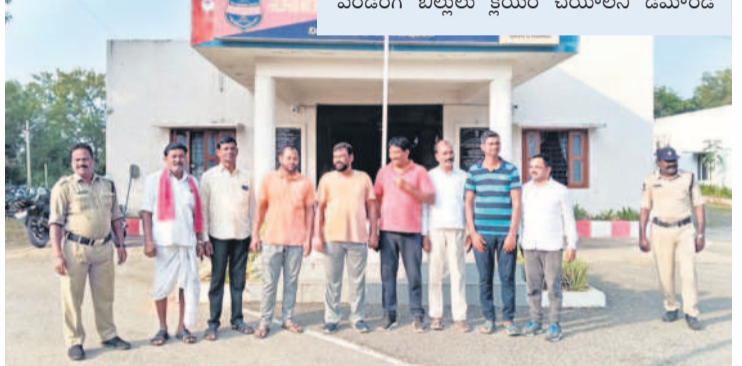
డివీపల్లి రాజాలో మాజీ ప్రజాప్రతినిధుల నిర్బంధం