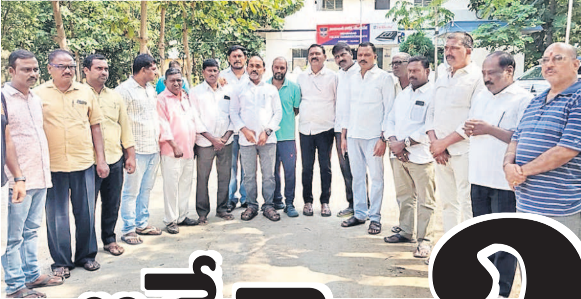
వెల్గూర్ పోలీసుస్టేషన్లో మాజీ సర్పంచులు, మాజీ ఉప సర్పంచులు