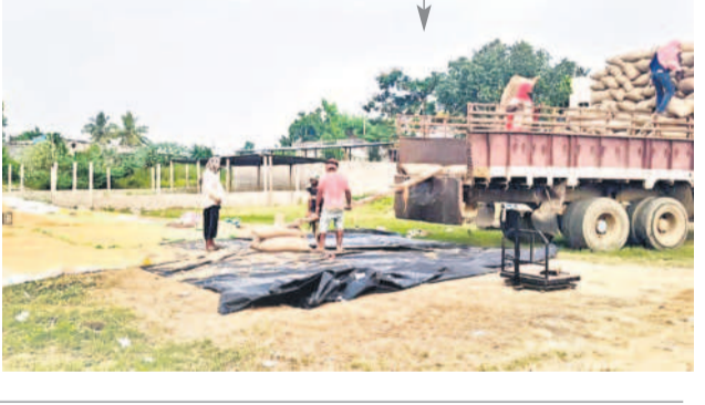
రుద్రూర్లో ధాన్యం సేకరణను అధికారులు

రుద్రూర్, నవంబర్ 4 : మండలకేంద్రంలో కొనుగోలు కేంద్రాల ద్వారా ధాన్యం సేకరణ ప్రక్రియను అధికారులు సోమవారం ప్రారంభించారు. గత నెల 15వ తేదీన కొనుగోలు కేంద్రాన్ని ప్రారంభించినా అధికారం వరకు ధాన్యం కొనుగోలు చేపట్టలేదు. ధాన్యం కొనుగోలు ప్రారంభించాలని కేంద్రం వద్ద వేసిన డియి కింద రైతులు కూర్చోని నిరసన తెలిపారు. దీనిపై 'నమస్తే తెలంగాణ' పత్రికలో 'ప్రారంభించారు.. పత్యాలే కుండా పోయారు' శీర్షిక వార్త ప్రచురితమైంది. స్పందించిన సంబంధిత అధికారులు.. కొనుగోలు కేంద్రంలో ధాన్యం సేకరణను ప్రారంభించేలా చర్యలు చేపట్టారు. దీంతో రైతులు సంతోషం వ్యక్తం చేశారు.