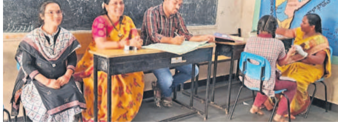
కులకర్ణ, నవంబర్ 4 : మండల కేంద్రంలోని కేజీబీబీ పాఠశాలలో ప్రాథమిక ఆరోగ్య కేంద్రం ఆధ్వర్యంలో సోమవారం వైద్యశిబిడిని నిర్వహించారు. 6, 7 వ తరగతి అమ్మాయిలకు హిమోగ్లోబిన్ పరీక్షలు నిర్వహించినట్లు పాఠశాల ఎన్.వో డివి తెలిపారు. కేంద్ర వైద్యశాఖ ఆదేశాల మేరకు ఈ కార్యక్రమాన్ని నిర్వహించినట్లు తెలిపారు. బాలికల్లో రక్తహీనతపై అవగాహన కల్పించడంతో పాటు పరీక్షలు నిర్వహించినట్లు తెలిపారు. కార్యక్రమంలో వైద్యసిబ్బంది, కేజీబీబీ పాఠశాల అధ్యక్షులు, విద్యార్థులు పాల్గొన్నారు.