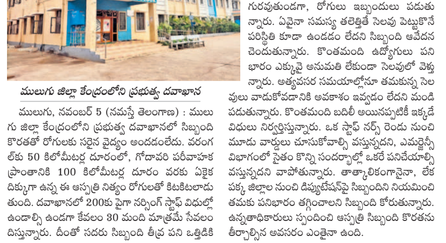
ములుగు జిల్లా కేంద్రంలోని ప్రభుత్వ దవాఖానా

ములుగు, నవంబరు 5 (సమస్య తెలంగాణ) : ములుగు జిల్లా కేంద్రంలోని ప్రభుత్వ దవాఖానాలో సిబ్బంది కొరతతో రోగులకు సరైన వైద్యం అందడంలేదు. వరంగల్ లో 50 కిలోమీటర్ల దూరంలో, గోదావరి వరీపాహాక ప్రాంతానికి 100 కిలోమీటర్ల దూరం వరకు ఏకైక డిస్పెన్సరీగా ఉన్న ఈ ఆస్పత్రి నిత్యం రోగులతో కిటికీలుదాని తుంది. దవాఖానాలో 200కు పైగా నర్సింగ్ స్టాఫ్ విధుల్లో ఉండాలి ఉండగా కేవలం 30 మంది మాత్రమే సేవలందిస్తున్నారు. దీంతో సదరు సిబ్బంది తీవ్ర పని బిడ్డికి వులు వాడుకోవడానికి అవకాశం ఇవ్వడం లేదని మండి పడుతున్నారు. కొంతమంది బదిలీ అయినప్పటికీ ఇక్కడే విధులు నిర్వహిస్తున్నారు. ఒక స్టాఫ్ నర్స్, రెండు నుంచి మూడు వార్డులు చూసుకోవాల్సి వస్తున్నదని, ఎమ్మెల్యే వి.వి.వి. సుబ్బారావు కౌన్సిలింగ్ కోసం నంద్యాల వచ్చి అక్కడే పనిచేయాల్సి వస్తున్నదని వాపోతున్నారు. తాత్కాలికంగానైనా, లేక పక్క జిల్లాల నుంచి డిప్యూటీవేస్ట్ సిబ్బందిని నియమించి తమకు పనిభారం తగ్గించాలని సిబ్బందిని కోరుతున్నారు. ఉన్నతాధికారులు స్పందించి ఆస్పత్రి సిబ్బంది కొరతను తీర్చాలని అవసరం ఎంతైనా ఉంది.