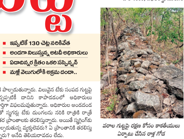
వరాల గుట్టపై రక్షణ కోసం కాకతీయులు ఏర్పాటు చేసిన రాళ్ల గోడ