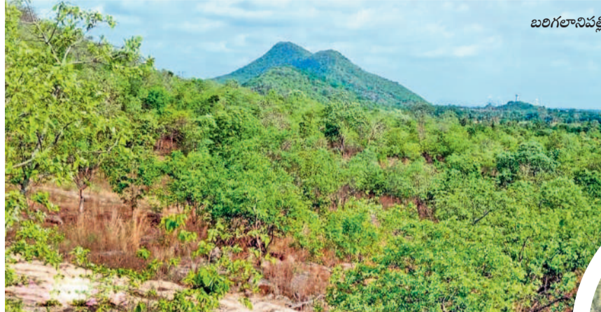
బంగిలాలనివేటిలోని వరాల గుట్ట