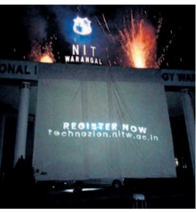
నిట్ లో అభివృద్ధిని టెక్నోజియాన్ లో జరిగిన