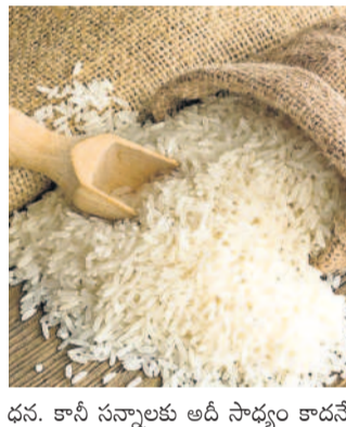
సన్న ధాన్యం విక్రయం

కోసం 280, సన్నవడ్ల కోసం ప్రత్యేకంగా 80 కేంద్రాలను ప్రారంభించారు. ఇప్పటివరకు డొడ్డరకం కోసుగోలు కేంద్రాలకు మాత్రమే ధాన్యం వచ్చింది.