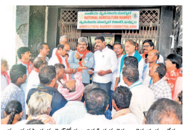
ఖమ్మం వ్యవసాయ మార్కెట్లో ధర్మా నిర్వహిస్తున్న రైతులు, రైతు సంఘం నేతలు