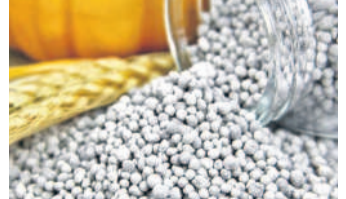
ఇలాంటి పరిస్థితుల్లో డి.ఎ.పి కోసం రైతులకు ఇబ్బందులు తప్పవనే అభిప్రాయాలు వ్యక్తం పుకున్నాయి.

హైదరాబాద్, నవంబర్ 7 (నమస్తే తెలంగాణ): యాసంగి పంట సాగుకు డి.ఎ.పి ఎరువుల కొరత తప్పదా? మార్కెట్లో, వ్యవసాయ శాఖ వద్ద బఫర్ స్టాక్ నిండుకున్నదా? డి.ఎ.పి సరఫరాపై ఎరువుల కంపెనీలు చేతులెత్తే సాయం? ప్రస్తుత పరిస్థితులు మాస్ట్రోవే టీటీఆర్ఎఫ్ సమాధానాలే వినిపిస్తున్నాయి.