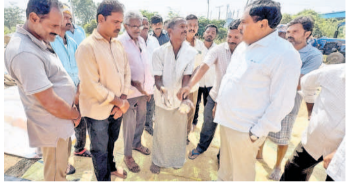
వరంగల్ జిల్లా వర్ధన్నపేట మండలం ఇల్లంద గ్రామంలో ఎర్రబెట్టి సమస్యలు వివరిస్తున్న రైతులు

వర్ధన్నపేట, నవంబర్ 7: నెల రోజులు దాటిగా ఇంతవరకు పడ్డ గోడు లభించలేదు. ధాన్యాన్ని పూర్తిగా ఆరబెట్టి కేంద్రాలకు తీసుకపోవడం కోసుగోళ్ళ ప్రారంభం కాలేదు.