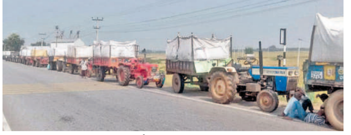
మిల్లాలగూడ శివారులోని మిల్లుల వద్ద నిలిచిన ధాన్యం ట్రాక్టర్ల

మిల్లాలగూడ, నవంబర్ 7: ఉమ్మడి నల్లగొండ జిల్లావ్యాప్తంగా సన్న ధాన్యం మిల్లాలగూడలోని మిల్లులకు తరలివస్తున్నది.