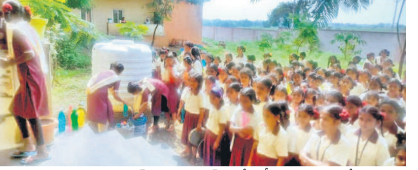
సంగారెడ్డి జిల్లా నాగేగిడ్ల మండలం కలనెగూడెంలోని ఎస్సీ గురుకుల కళాశాలలో తాగునీటి కోసం వాటర్ ట్యాంకు వద్ద బారులుతీసిన విద్యార్థులు