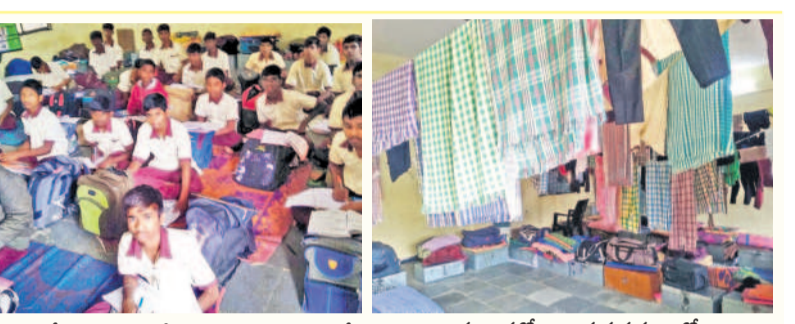
దుబ్బాకలో సాంఘిక సంక్షేమ బాలుర గురుకులంలో తరగతి గదిలో నేలపైనే విద్యనభ్యసిస్తున్న విద్యార్థులు

జిల్లాలోని అధికారంలో గురుకుల కళాశాలలో సిబ్బంది కొరత ఉంది. రెగ్యులర్ లెక్కలపై లెక్కపాడడంతో బోధనపై ప్రభావం పడుతున్నది. ఇటీవల న్యూరల్ లో