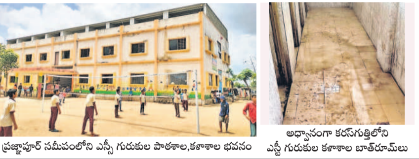
అధ్యాసంగా కరనగూడెంలోని ప్రజ్ఞాపూర్ సమీపంలోని ఎస్సీ గురుకుల పాఠశాల, కళాశాల భవనం

దుబ్బాకలో బాలుర గురుకులంలో తరగతి గదిలోనే బట్టలు అరబెట్టుతుంటున్న విద్యార్థులు