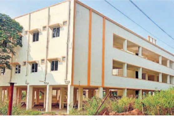
వంద గదులతో నిర్మించిన ధర్మశాల

మహాదేవపూర్ మండలం కాళేశ్వరంలోని కాళేశ్వర ముక్తేశ్వరస్వామి ఆలయ అభివృద్ధికి బిఆర్ఎస్ ప్రభుత్వం రూ. 25 కోట్ల మంజూరు చేసి 32 పనులు చేపట్టి, వీటి పర్యవేక్షణ బాధ్యతలను దేవారాయ, పంచాయతీరాజ్, అటవీ, ఉద్యానశాఖ, సులభ ఇంటర్నేషనల్ సంస్థకు అప్పగించింది. ఆలయం ఎంప్లొయ్మెంట్ ముందు ఫోరం, కిచెన్ హాలు, యాత్రికుల కోసం 15 గదులతో సముదాయం, క్యూ, షాపింగ్ కాంప్లెక్స్, పదిహేను గదులతో అవర కర్ఫు మండపం, వంద గదులతో ధర్మశాల, నలభై గదులతో ధార్మిక బోర్డు, గోదావరి స్నానస్థలాలనుంచి బస్ స్టేషన్ వరకు చేపట్టే డ్రైనేజీ, రోడ్డు నిర్మాణం, ఆలయం చుట్టూ ప్రహారీ, తదితర పనులకు నిధులు మంజూరు చేయగా, కొన్ని సాంకేతిక కారణాలతో ప్రారంభం కాకపోగా అధిక శాతం పనులు చివరి దశకు చేరుకున్నాయి. వంద గదులతో ధర్మశాల రూ. 8 కోట్లతో ఆలయం సమీపంలో భక్తుల సౌకర్యార్థం వంద గదులతో ధర్మశాల నిర్మాణం చేపట్టారు. ఈ భవనంతో పాటు రూ. 1.25 కోట్లతో చేపట్టిన 40 గదుల ధర్మశాల పనులు పనులు 90 శాతం పూర్తయ్యాయి. రూ. 1.10 కోట్లతో నిర్మించిన కిచెన్, అన్న దానం హాలు, రూ. కోట్లతో ఏర్పాటు చేసిన క్యూ కాంప్లెక్స్ పనులు పూర్తి చేసి ప్రారంభించారు. అవర కర్ఫు మండపానికి రూ. 1.50 కోట్ల మంజూరు చేయగా స్థల సమస్యతో పనులు ప్రారంభం కాలేదు. రూ. 50 లక్షలతో షాపింగ్ కాంప్లెక్స్ నిర్మాణం, రూ. 3.75 కోట్లతో అనిష్టి