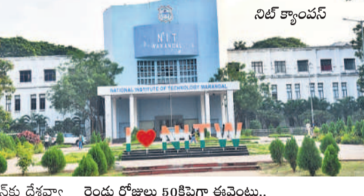
వరంగల్ నిట్ క్యాంపస్

మామకూడ రోజుల పాటు నిర్వహణ పాలిగ్రాఫ్ ను 5 వేల మంది ఇంజనీరింగ్ విద్యార్థులు 50కి పైగా ఈవెంట్ల ద్వారా హనుమంట్ చౌరస్తా, నవంబర్ 7 : దక్షిణ భారతదేశంలోనే అతిపెద్ద సాంకేతిక కోశంగా పేరుగాంచిన టెక్నోజియాన్-24ను వరంగల్ నిట్ మున్పెట్టెంది. ఈనెల 8 నుంచి 10 వరకు నిర్వహించేందుకు విద్యార్థులు ఏర్పాట్లు చేశారు. టెక్నోజియాన్ దేశవ్యాప్తంగా ఉన్న ఇంజనీరింగ్ కాలేజీల నుంచి సుమారు 5 వేల మందికి పైగా విద్యార్థులు పాల్గొనున్నారు. 2006 నుంచి ప్రతి ఏడాది వరంగల్ నిట్లో ఈ కార్యక్రమాన్ని నిర్వహిస్తున్నారు. విద్యార్థులలో దాకి ఉన్న సామాజికత, సాంకేతిక పరిజ్ఞానాన్ని ప్రదర్శించేందుకు ఇది ఎంతగానో ఉపయోగపడుతుంది. విద్యార్థులలో నిర్మాణాలకు నిర్వహించే ఈ టెక్నోజియాన్ ప్రతి ఏడాది ఒక కొత్త టీమ్ తో వేడుకలను నిర్వహించునున్నారు. ఈ ఏడాది డివీను అవిష్కరణను చేస్తున్నారు.