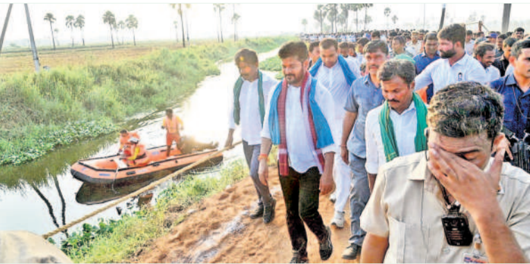
ముఖ్యమంత్రి రేవంత్ రెడ్డి పర్యటన నేపథ్యంలో సంగం వద్ద మూసీలో అప్పటికప్పుడు తాత్కాలికంగా ఏర్పాటుచేసిన బోట్