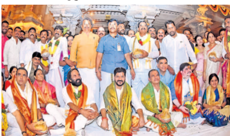
తన పుట్టిన రోజు సందర్భంగా యాదగిరిగుట్ట అలయంలో పూజాధిపతి పార్టీల్స్ సీఎం రేవంత్ రెడ్డి

నల్లగొండ ప్రజలు మూసీలోనే పాతరేస్తారని పేర్కొన్నారు. నల్లగొండ ఫోర్టై సమస్యతో పుట్టిన దుఃఖం పడుతుంటే కలిసిరావా? మూసీ పునరుజ్జీవ పథకానికి కలిసిరాకపోతే మూసీ మురికిలో చది కొట్టకపోతే, దిక్కులేని రాపు చిన్నవే అని పరుష వ్యాఖ్యలు చేయడంపై విమర్శలు వినిపిస్తున్నాయి. సీఎం స్థానంలో ఉన్న రేవంత్ రెడ్డి హంగామా వ్యవహారంపై మూసీ బజారు భాష మాట్లాడటంపై ముక్కున వేలేసుకుంటున్నారు.