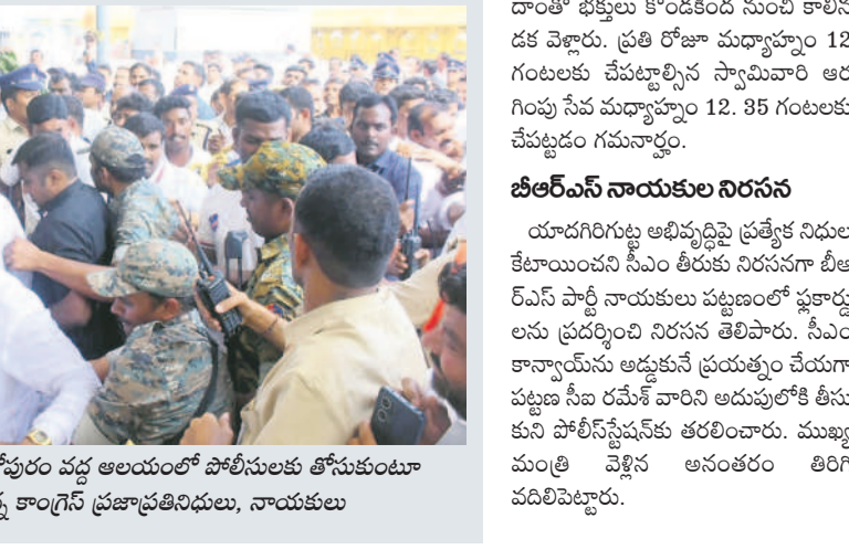
తూర్పు రాజగోపూర్ వద్ద ఆలయంలో పోలీసులకు తోసుకుంటూ వెళ్ళుతున్న కాంగ్రెస్ ప్రజాప్రతినిధులు, నాయకులు

తెచ్చిత్రవం పనులు పెండింగ్లో ఉన్నాయని, నిత్యన్వన సత్తం, రహదారుల నిర్మాణం, పార్కింగ్ పనులు నిలిచిపోయాయని వివరించారు. గతంలో భూసేకరణ చేపట్టిన 110 ఎకరాలకు కూడా 60 కోట్లు నష్టపోవడం జిల్లాలో ఉంది చెప్పారు. సమావేశంలో సీఎం రేవంత్ రెడ్డి గంటలు మాట్లాడుతూ మరో రూ.100 కోట్లు మంజూరు చేస్తే పనులు పూర్తి చేయచ్చునని పేర్కొన్నారు. సుమారు రెండున్నర గంటలు మాట్లాడుతూ ఆ సమయంలో సీఎం రేవంత్ రెడ్డి.. పెండింగ్ పనులు పూర్తి చేయాలి.. కొండవీడు భక్తుల నిర్లక్ష్యం ఏర్పాటు చేయాలి.. బ్రహ్మోత్సవాల్లో పునరావేశం వల్ల మంజూరు చేయవచ్చునని పేర్కొన్నారు. సుమారు రెండున్నర గంటలు మాట్లాడుతూ ఆ సమయంలో సీఎం రేవంత్ రెడ్డి.. పెండింగ్ పనులు పూర్తి చేయాలి.. కొండవీడు భక్తుల నిర్లక్ష్యం ఏర్పాటు చేయాలి.. బ్రహ్మోత్సవాల్లో పునరావేశం వల్ల మంజూరు చేయవచ్చునని పేర్కొన్నారు. సుమారు రెండున్నర గంటలు మాట్లాడుతూ ఆ సమయంలో సీఎం రేవంత్ రెడ్డి.. పెండింగ్ పనులు పూర్తి చేయాలి.. కొండవీడు భక్తుల నిర్లక్ష్యం ఏర్పాటు చేయాలి.. బ్రహ్మోత్సవాల్లో పునరావేశం వల్ల మంజూరు చేయవచ్చునని పేర్కొన్నారు.