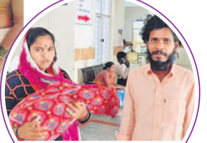
దవాఖానాలోని ఫార్మీస్లో మందులేక పోవడంతో తిరిగి వచ్చిన స్త్రీలకు

నిరాశ ఎదురవుతున్నది. దవాఖానా కేర్ల సరిగ్గా వైద్యులు అందుబాటులో ఉండడం లేదని, అరకొరగా వైద్యం అందుతున్నదని.. మందుల కొరవ వైద్యులు చీటీలు రాస్తే.. అక్కడి ఫార్మీస్లో అందుబాటులో లేవని బయట ఉన్న మెడికల్ షాపుల్లో కొనుక్కోవాలని అక్కడి సిబ్బంది సూచిస్తున్నారని రోగులు ఆవేదన వ్యక్తం చేస్తున్నారు.