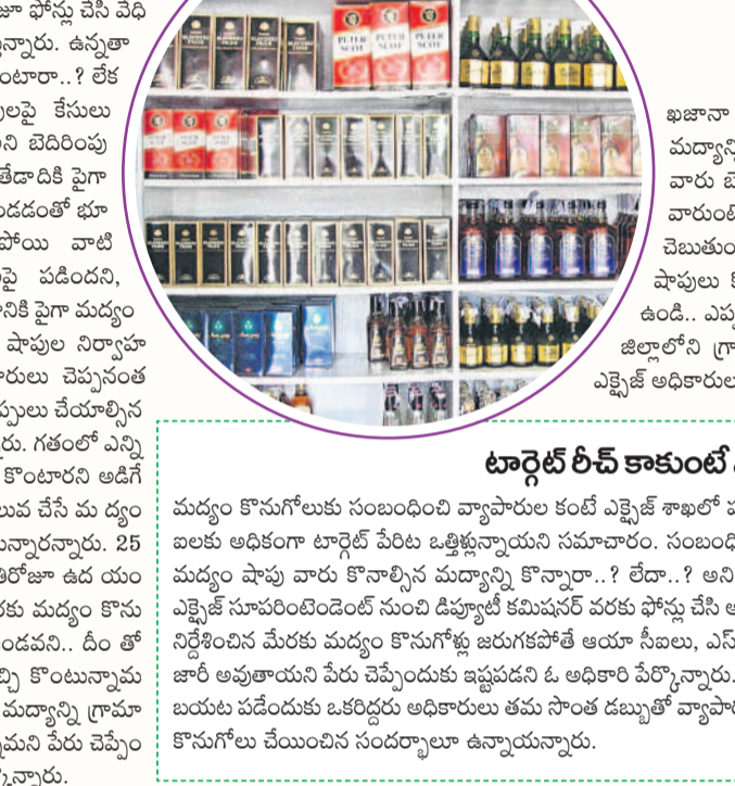
మధ్యం కొనుగోలుకు సంబంధించి వ్యాపారుల కంటే ఎక్సైజ్ శాఖలో పనిచేసే సీబి, ఎసి ఇతర అధికారుల టార్గెట్ పేరిట ఒత్తిళ్లున్నాయని సమాచారం. సంబంధిత నెలల్లో ఒక్కో మధ్యం షాపు వారు కొనాల్సిన మధ్యం కొనాల్సినారా..? లేదా..? అని సీబి, ఎసి ఇతర అధికారులు అబద్ధమైన చర్యలకు దిగుతున్నారు.

వికారాబాద్ జిల్లాలో 59 మధ్యం దుకాణాలు, 7 బార్లు ఉన్నాయి. వాటిలో ప్రతినెలా రూ. 53 కోట్ల వరకు మధ్యం విక్రయాలు జరుగుతుంటాయి. వివాహాల సీజన్, దసరా, సంక్రాంతి పండుగల సమయాల్లో మధ్యం అమ్ముతారు మరియు అధికంగా ఉండడంతో సబంధిత నెలల్లో సుమారు రూ. 80 కోట్ల వరకు విక్రయాలు జరుగుతాయి.