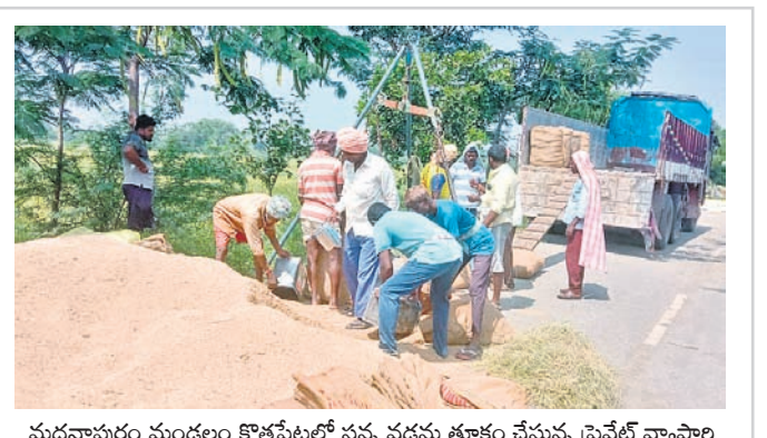
మదనాపురం మండలం కొత్తపేటలో సన్న వడ్డను తూకం చేస్తున్న ప్రైవేట్ వ్యాపాల