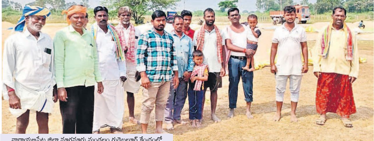
నారాయణపేట జిల్లా మాగూరు మండలం గుడెలూర కేంద్రంలో ధాన్యం కొనుగోలు వెంటనే ప్రారంభించాలని డిమాండ్ చేస్తున్న రైతులు