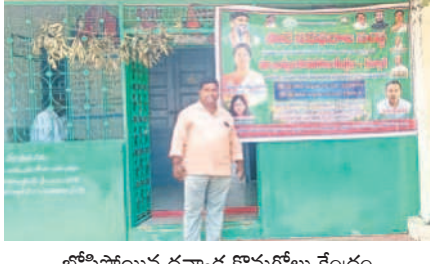
బోనోపాపం ధాన్యం కొనుగోలు కేంద్రం

కొనుగోలు కేంద్రాలకు చేరని సామగ్రి : వనపర్తి జిల్లాలో ధాన్యం కొనుగోలు కేంద్రాలకు ఆసక్తిగా మారినది. దసరా నుంచి జిల్లాలో వరికోకలు సమస్యంగా, ధాన్యం కొనుగోలు చేసే అసాధ్య కనిపించడం లేదు. అక్కడక్కడా కొన్ని సెంటర్లకు సాగు చేసినా, అక్కడక్కడా సాగు చేయనివ్వడం లేదు. దాదాపు వరకు రోజుల కిందట ఎమ్మెల్యేలు ప్రారంభించిన కేంద్రాల్లోనూ ఒక్క వడ్డ గింజ కూడా సర్కారు కొనుగోలు చేయలేదంటే జిల్లాలో ప్రభుత్వం కొనుగోలు పరిస్థితి ప్రత్యేకంగా చెప్పవచ్చు. ప్రైవేట్ వ్యాపారులు మాత్రం ప్రభుత్వం కంటే ముందుగా సామగ్రిని కొనుగోలు చేస్తున్నారు. నంద్యాల సెంటర్లో సామగ్రిని కొనుగోలు చేస్తున్నారు. ఇప్పటి వరకు జిల్లాలో 30వేల మెట్రిక్ టన్నుల పరి ధాన్యాన్ని ప్రైవేట్ వ్యాపారులు కొనుగోలు చేసినట్లు అనధికార అంచనా.