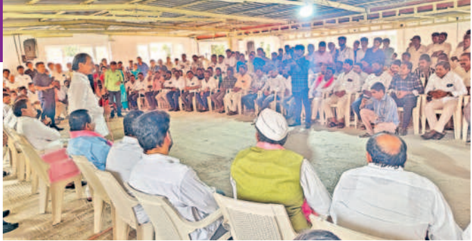
పార్టీ శ్రేణులనుద్దేశించి మాట్లాడుతున్న మహా సీఎం కేసీఆర్

ఓట్లు వేకారని, అవి చేతల రూపం దాల్చువనే విషయం ప్రజలకు బోధపడింది. ఇక ఏ ఎన్నికలు ఇచ్చినా జనం బీఆర్ఎస్ వెంట ఉంటారని అక్షర సత్యమవుతోంది. మనం కష్టపడి పనిచేస్తే స్థానిక సంస్థలు మొలకలు, పన్నే అంటే ఎన్నికల పరక అన్ని విజయాలను మనవేనని కేసీఆర్ అన్నారు. ప్రభుత్వం అంటే అందరినీ కాపాడాలని, నిర్మాణం చేయాలని, పది మందికి లాభం జరగాలని, ముఖ్యంగా రైతులు, సామాన్యులకు సంక్షేమ పథకాలు అందాలన్నారు. ఇదంతా పక్కనవేసి ప్రతిపక్ష పార్టీ వాళ్లను లోపల వేస్తూమని ఊడరగొడుతున్నారని, ఇదేనా వాళ్ల వేసి అభివృద్ధి అన్నారు. కాంగ్రెస్ వాళ్లు ఇచ్చిన హామీల్లో ఒక్క శాతం పూర్తి చేయలేదని, అదే మన ప్రభుత్వం జనం అడగని పథకాలు ప్రజలకు అందించామన్నారు. కాంగ్రెస్ పార్టీకి విత్తపడ్డి లక్షలు, కేవలం అధికారం చేజిక్కించుకున్నందుకే అనేక అలవికాని హామీలు ఇవ్వడంతో ప్రజలు విశ్వసించడం వేరవుతున్నారని, ఇప్పటికైనా మునిగిపోయిందేమీ లేదని, ప్రజలు పునరాలోచించుకున్నారన్నారు. రానున్నది మనపాలనే అని, ప్రజలకు రెట్టెప్పు అభివృద్ధి, సంక్షేమాల అందించి