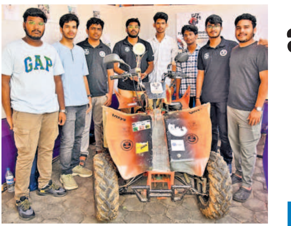
విద్యార్థులు తయారుచేసిన ఆధునిక బైక్