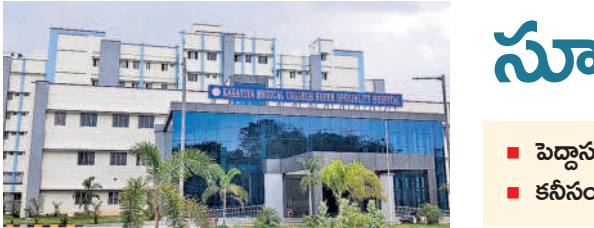
కాకతీయ సూపర్ స్పెషాలిటీ హాస్పిటల్