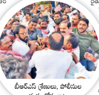
బీఆర్ఎస్ శ్రేణులు, పోలీసుల మధ్య తోపులాట