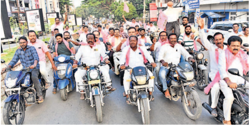
సీఎం రేవంత్ రెడ్డి దిష్టిబొమ్మతో ర్యాలీగా వస్తున్న బీఆర్ఎస్ శ్రేణులు