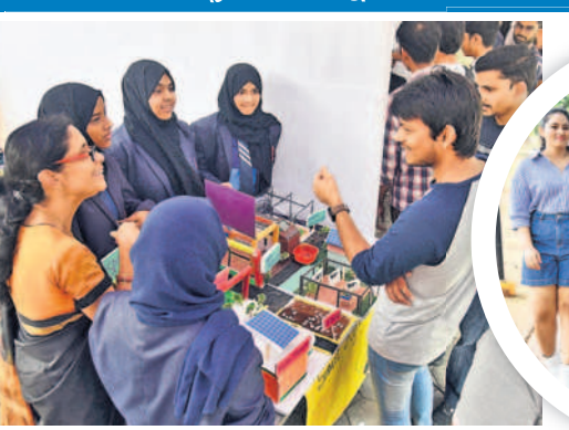
నిట్లో రోబోటిక్స్ ప్రదర్శనలు