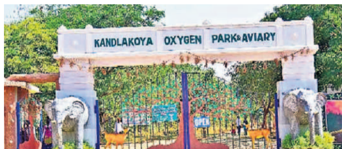
మేడ్చల్-మల్కాజిగిరి జిల్లాలోని కండ్లకోయ అక్షిణి పార్క్

జిహాద్‌ఎన్‌సీ ప్రభుత్వ హయాంలో 17 పార్కుల అభివృద్ధి పర్యాటక పరిరక్షణకు బీఆర్ఎస్ ప్రభుత్వం ప్రత్యేక దృష్టిని సారించింది.