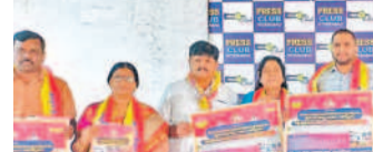
సికింద్రాబాద్ గురునానక్ 55వ జయంతి వేడుకలు

సికింద్రాబాద్ గురునానక్ 55వ జయంతి వేడుకలు సాగింది.