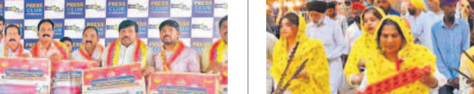
విద్యార్థులకు సౌకర్య సృష్టన సందర్భంగా

విద్యార్థులకు సౌకర్య సృష్టన సందర్భంగా విద్యార్థులకు సౌకర్య సృష్టన.