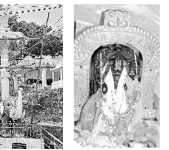
బ్రహ్మాత్మ వాళి ముగిసిన తర్వాత శ్రీ లక్ష్మీ నరసింహస్వామి ఆలయం గర్భగుడిలో స్వామివారు

రుద్దంగి, నవంబర్ 12: మండల కేం డ్రంలోని ప్రహ్లాద పర్వతంపై వెలిసిన శ్రీ లక్ష్మీనరసింహ స్వామివారి బ్రహ్మాత్మ వాళి రేపటి(గురువారం) నుంచి ప్రారంభంకాను న్నాయి. కొంత కోర్కెలు తీర్చే స్వామివారిని దర్శించుకుని కొరవలను, పట్టణాచారాల సమర్పించేందుకు భక్తులు పెద్దపత్తున తర లిరానున్నారు. కార్తీక మాసం సందర్భంగా గురువారం నుంచి శనివారం వారు బ్రహ్మా త్మ వాళి నిర్వహించుతూ, ఆలయ కమిటీ ఆధ్వర్యంలో ఏర్పాటు పూర్తయ్యాయి. గురువారం సాయంత్రం 5.05గంటలకు స్వామివారి తిక్కోళ్లు వైభవంగా జర గనుంది. ఆలయ కమిటీ చైర్మన్ కొమ్మి