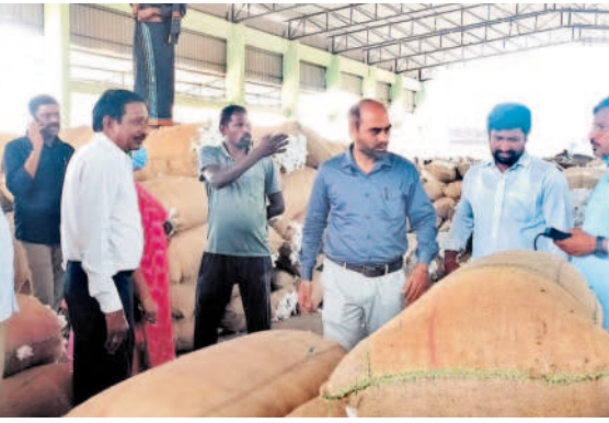
కలెక్టర్ ఆదేశాలకు అనుగుణంగా పత్తిలో తేమ శాతం పరీక్షలు చేస్తున్న ఖమ్మం ఏఎన్ఎల్ అధికారులు

చ్చింది. సీసీ బీబీలు, జీసీఆర్ఎస్ కాంటాలు, ఈ-నామ్, ఈ-టామ్ వంటి విధానాలను అమల్లోకి తెచ్చింది. అన్ని పంటల్లో తేమ శాతాన్ని నిర్ధారించేందుకు తేమ శాతం నిర్ధారణ యంత్రాలను కూడా అందుబాటులో ఉంచింది. వీటి ద్వారా పంటలను కొనుగోలు చేసే నాణ్యతా ప్రమాణాల కలెక్టర్ రైతులకు మద్దతు ధర చెల్లింపాల్సి వ్యాపారులు.. ఇటీవల కాంటా తమ ధరలను చెబుతూ రైతులను