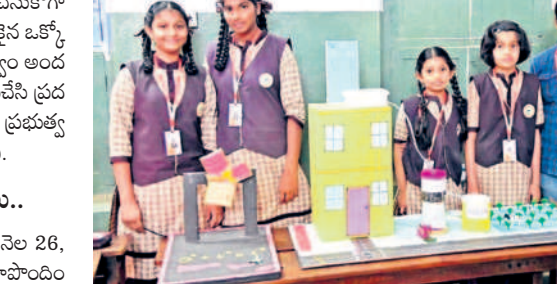
సైన్స్ డెయిర్ ప్రదర్శనలో పాల్గొన్న విద్యార్థులు (ఫైల్)

ధర్మాకోట్ సిషిద్ధం.. సైన్స్ డెయిర్ ప్రదర్శనలో విద్యార్థులు ధర్మాకోట్ అట్టలను, ట్రాయ్ లో షీట్లను, ఫెక్సీలను ప్రదర్శించారాడని డిఈవో స్పష్టం చేశారు. వీటితో తయారుచేసే ప్రాజెక్టులను పూర్తిగా నిషేధిస్తున్నట్లు చెప్పారు. ఈ కార్యక్రమంలో సంఘాల నాయకులు, ఎంఈవోలు, సైన్స్ అధికారి, ప్రైవేట్ స్కూళ్ల బాధ్యులు పాల్గొన్నారు.