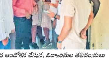
పాఠశాల వద్ద ఆందోళన చేస్తున్న విద్యార్థినుల తల్లిదండ్రులు