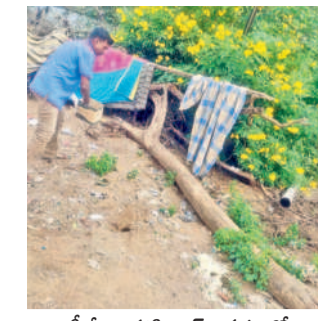
నీకేమం హాస్పిటల్ ఆవరణలో ఎలుకల నివారణకు మందు చల్లుతున్న శానిటేషన్ సిబ్బంది