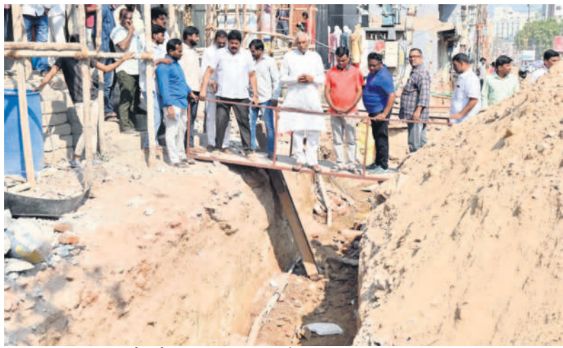
మార్కెట్ రోడ్లో తవ్విన కాలువను పరిశీలిస్తున్న మాజీ ఎమ్మెల్యే దివాకర్ రావు