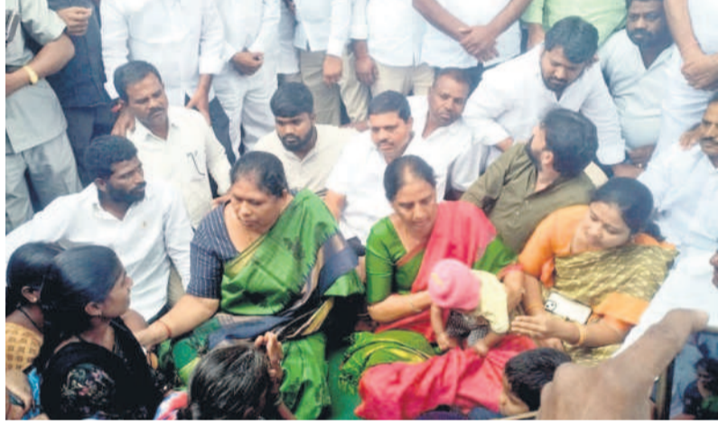
నేలపై కూర్చోని రైతులను పరామర్శిస్తున్న ఎమ్మెల్యే కోవలక్ష్మి మాజీ మంత్రి సబితా ఇంద్రారెడ్డి

● రైతులకు బీఆర్ఎస్ భరోసాగా ఉంటుంది ● ఆసిఫాబాద్ ఎమ్మెల్యే కోవలక్ష్మి ● పరిగి సబ్ జైలులో ఉన్న మాజీ ఎమ్మెల్యే, రైతులకు పరామర్శ