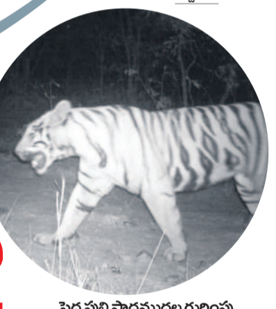
పెద్ద పులి పాదముద్రల గుర్తింపు

కాసిపేట, నవంబర్ 14 : కాసిపేట మండలం దేవాపూర్, ధర్మారావుపేట, వెంకటాపూర్ అటవీ ప్రాంతం నుంచి కుటుంబం ఆసిఫాబాద్ జిల్లా తిర్యాలి పులిని నిర్మలం గ్రామం చేస్తూ... పులి సంచారం ఎక్కడ ఉంటే అక్కడ ప్రాంతాల ప్రజలను అప్రమత్తం చేస్తూ వచ్చారు. పులి విషయంలో తీసుకోవాల్సిన జాగ్రత్తలపై అవగాహన కార్యక్రమాలు నిర్వహించారు. ఈ నేపథ్యంలో నాలుగు రోజుల క్రితం లక్ష్మిపేట రెంజ్ డాటుకొని బెల్లంపల్లి రెంజ్ ముఖ్యంపల్లి, దేవాపూర్ మీదుగా తిర్యాలి అడవిలోకి వెళ్లిన ప్రవేశించినట్లు అటవీశాఖ అధికారులు తెలిచారు. ఈ పులి అడవిలోని గుతులను, అందులో భాగంగానే తిర్యాలి అడవిలోకి వెళ్లిందని అటవీశాఖ అధికారులు పేర్కొన్నారు.