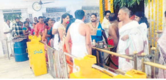
స్వామివారిని దర్శించుకుంటున్న భక్తులు