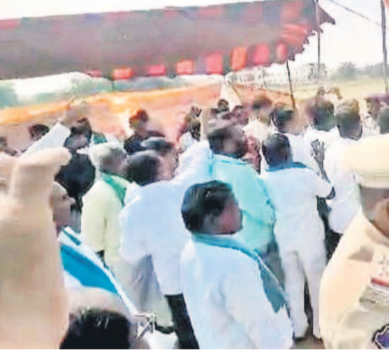
ఘటనా స్థలం వద్ద కాంగ్రెస్, బీజేపీ నాయకుల వాగ్వాదం