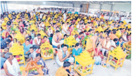
దండేపల్లి : సామాహిక వ్రతాలు నోముకుంటున్న భక్తులు