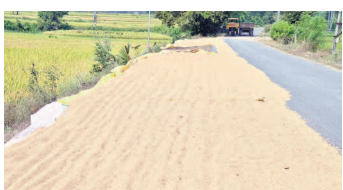
గొల్లపల్లిలో రోడ్డు పక్కన అరబెట్టిన దాన్యం