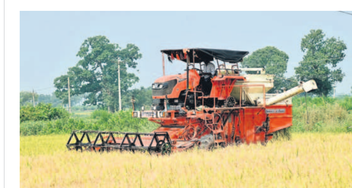
వడ్డనపల్లిలో వరి కోతలు