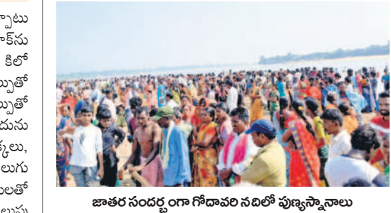
జాతర సందర్భంగా గోదావరి నదిలో పుణ్యస్నానాలు ఆచరించేందుకు తరలివచ్చిన భక్తులు

కోటపల్లి, నవంబర్ 15 : కోటపల్లి మండలం జనగామ గ్రామం లోని మదన పోచమ్మ జాతర శుభ్రవారం వైభవంగా ప్రారంభమైంది. జనగామ నుంచి అమ్మవార్లను ఊరేగింపుగా పాఠశాల సమీపంలోని చండ్రో ఉత్తరవాహిణికి తీసుకువచ్చారు. అక్కడ అమ్మవార్లకు జలాభిషేకాలు నిర్వహించారు. చుట్టు పక్క గ్రామాలు నుంచి భక్తులు పెద్ద సంఖ్యలో తరలివచ్చి గోదావరి నదిలో పుణ్య స్నానాలు ఆచరించారు. అప్పై పూజలు చేశారు. నేడే అమ్మవారి రథోత్సవం, ఆదివారం అమ్మవార్లకు బోనాలు సమర్పణతో జాతర ముగియనున్నట్లు నిర్వాహకులు తెలిపారు.