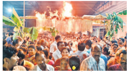
మంచిర్యాల లద్దెన్ : జ్యాలాతోరణం నుంచి వేంకీశ్వర స్వామి వారిని ఊరేగిస్తున్న ఆలయ భక్తులు