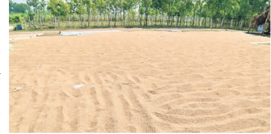
పెద్దపేటలో ధాన్యం రాతులు

మంచిర్యాల, నవంబర్ 15 (నమస్తే తెలంగాణ ప్రతినీడి) : కాంగ్రెస్ అధికారంలోకి వస్తే మద్దతు దరకు ధాన్యం కొనడంతో పాటు సన్న రకాలకు క్వింటాల్ రూ.500 బోనస్ ఇస్తామన్న హామీ ఉత్త బోగస్ అని తేలిపోయింది. సన్నాలకు బోనస్ ఇవ్వేందుకు కోట్లాది రూపాయలు కేటాయించామని గోపాలు చెప్పుకుంటున్న సర్కారు.. 33 రకాలకే బోనస్ అంటూ మెలిక పెట్టింది. కొన్ని రకాల ధాన్యాల పేర్లు చెప్పి, వాటినే సన్నాలుగా పరిగణిస్తామని స్పష్టం చేసింది. ఇక ఈ విషయం తెలియని రైతులు సన్న వడ్డ పట్టుకొని కొనుగోలు కేంద్రానికి వెళ్లి చాలు.. క్వింటాకు రూ.500 బోనస్ వస్తుందనుకుంటున్నారు. కానీ.. అసలు విషయం ఏమిటంటే ప్రభుత్వం చెప్పిన 33 రకాలకే బోనస్ వర్తిస్తుంది. ఆ 33 రకాలను కూడా గ్రేడ్ క్వాలిఫైర్ అనే పరికరంలో పెట్టి పాడవు, వెడల్పు కొలుస్తారు. ధాన్యం గింజ పాడవు 6 ఎం.ఎం కంటే తక్కువగా.. గింజ వెడల్పు 2 ఎం.ఎం కంటే తక్కువగా ఉండాలి. ఈ పాడవు, వెడల్పుల నియంత్రణ మొత్తం కలిపితే 2.5 ఎం.ఎం కంటే ఎక్కువగా ఉండాలి. అప్పుడే దాన్ని సన్నరంగా పరిగణిస్తే తీసుకుంటారు. మైగా ధాన్యం తేమ శాతం 17 శాతం కంటే ఎక్కువగా ఉండకూడదు. ఇచ్చే రూ.500 బోనస్ కు ఇన్ని రకాల కొర్రలు పెట్టిన సర్కారు రాష్ట్రంలో 48.91 లక్షల అన్నుల సన్న పరి దిగుబడి వస్తుందని, ఆ మొత్తానికి రూ.500 చొప్పున చెల్లించేందుకు రూ.2,445 కోట్లు అవసరమవుతాయని చెప్పుకుంటుంది. క్షేత్రస్థాయిలో వాస్తవ పరిస్థితి మాత్రం ఇందుకు పూర్తిగా భిన్నంగా ఉంది.