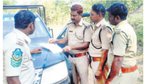
సఫారీ వాహనం వద్ద రోడ్ మ్యాప్ ను పరిశీలిస్తున్న ఎఫ్.ఆర్.ఎస్., అధికారులు