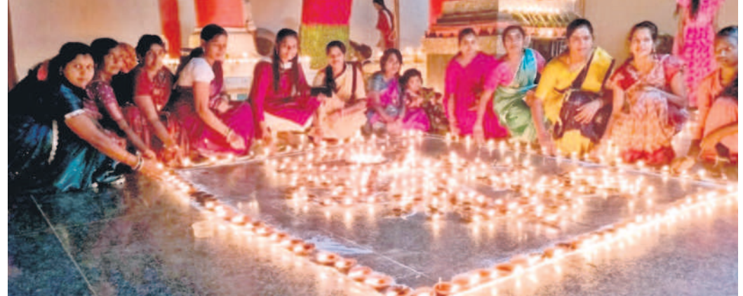
దహగాం : ఆలయంలో దీపాలను వెలిగిస్తున్న భక్తులు