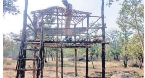
అడవిలో నిర్మాణం చేస్తున్న మంచె