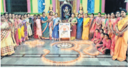
తాండూర్ : ఐతేలి తులసి వ్రతం నిర్వహిస్తున్న మహిళలు