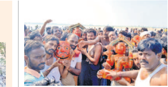
గోదావరి నదిలో అమ్మవార్లకు అభిషేకాలు నిర్వహిస్తున్న భక్తులు

దాదాపు ఐదు కుంటలు, ఐదు మంచెలను ఏర్పాటు చేశారు. నీటి కుంటల పక్క నుంచి సఫారీ (ట్రాక్)ను ఏర్పాటు చేస్తున్నారు. మరో రూ. 12 లక్షలతో 20 కిలో మీటర్లు ప్రయాణించేందుకూ 24 మీటర్ల వెడల్పుతో పిప్పి మొక్కలను తొలగిస్తున్నారు. 14 పీట్ల వెడల్పుతో సఫారీ వాహనం వెళ్లొందుకు ఏలూగా భూమి చదును చేస్తున్నారు. అడవిలో వెనుక, కుందేళ్లు, రేన్ కుక్కలు, దుప్పలు, జింకలు, మెకాలు, తోడెళ్లు, నక్కలు, ఎలుగు బంట్లు, అడవి దున్నులు, చిరుత పులులు, పెద్దపులులతో పాటు వివిధ రకాల పక్షులున్నట్లు అధికారులు తెలుపు తున్నారు.