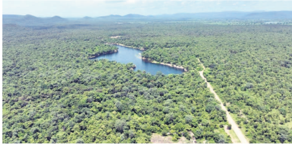
నీటి కొలను పక్కనుంచి వెళ్తున్న జంగల్ సఫారీ దారి