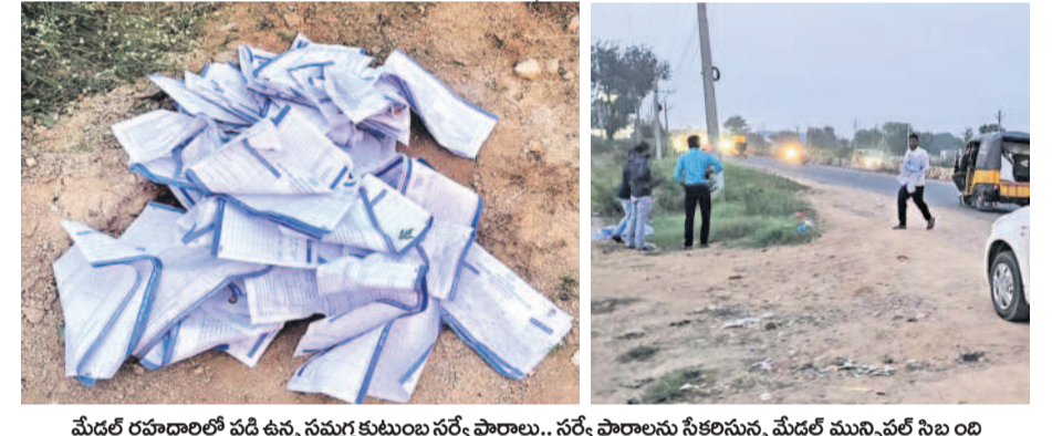
మేధ్యల్ రహదారిలో పడి ఉన్న సమగ్ర కుటుంబ సర్వే ఫారాలు.. సర్వే ఫారాలను సేకరిస్తున్న మేధ్యల్ మున్సిపల్ సబ్జెంట్