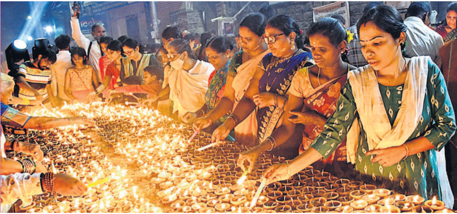
కార్తిక పౌర్ణమి సందర్భంగా శుక్రవారం సగరంలోని వలు ఆలయాలు భక్తులతో తిట్టరబడ్డాయి. సెకండ్రీబాద్ పద్మావతి నగర్లోని సాయిబాబా ఆలయంలో లక్ష్మీ దీపాలను వెలిగిస్తున్న భక్తులు

ప్రభుత్వం చేపట్టిన సమగ్ర కుటుంబ సర్వే భద్రతపై నమ్మకం లేదని ఆటో యూనియన్ నాయకులు ఆగ్రహం వ్యక్తం చేశారు. సర్వేకు సంబంధించిన ఫారాల మేధ్యల్ పట్టణ సమీపంలోని రేకులబావి నుంచి భారత్ ప్రెజ్ లో బోర్డు వరకు పడి ఉన్న ఘటనపై సుప్రీంకోర్టు ఆంధ్రా సర్వేకు సంబంధించిన సర్వే ఫారాలను మాసి తాము సేకరించామని చూపించారు. ఉన్నతాధికారులు ఈ విషయంపై స్పందించాలని డిమాండ్ చేశారు. - మేధ్యల్