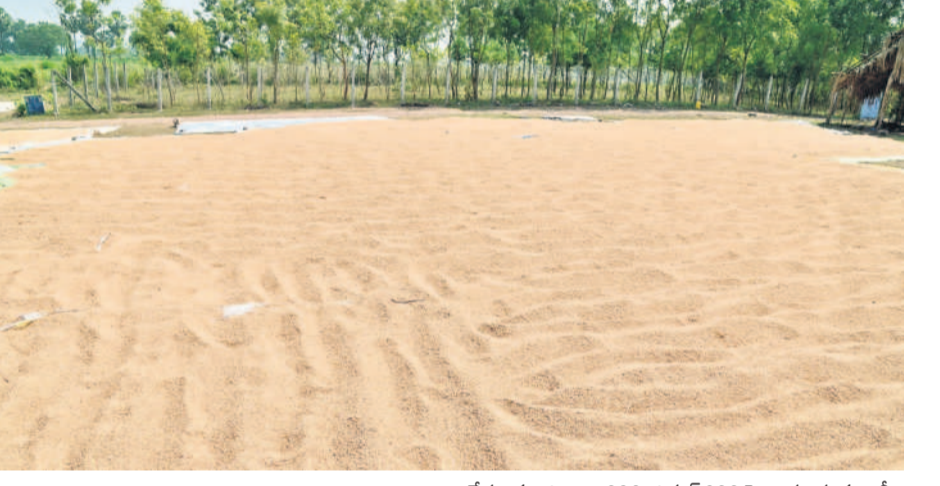
పెద్దపేటలో ధాన్యం రాతులు

మంచిర్యాల, నవంబర్ 15 (నమస్తే తెలంగాణ ప్రతినిధి) : కాంగ్రెస్ అధికారంలోకి వస్తే మద్దతు దరకు ధాన్యం కొనడంతో పాటు సన్న రకాలకు క్వింటాల్ రూ.500 బోనస్ ఇస్తామన్న చూమీ ఉత్త బోగన్ అని తేలిపోయింది. సన్నాలకు బోనస్ ఇచ్చేందుకు కోట్లాది రూపాయలు కేటాయించామని గోపాలు చెప్పుకుంటున్న సర్కారు.. 33 రకాలకే బోనస్ అంటూ మెలిక పెట్టింది. కొన్ని రకాల ధాన్యాల పేర్లు చెప్పి, వాటినే సన్నాలుగా పరిగణిస్తామని స్పష్టం చేసింది. ఇక ఈ విషయం తెలియని రైతులు సన్న వడ్డ పట్టుకొని కొనుగోలు కేంద్రానికి వెళ్లే చాలు.. క్వింటాకు రూ.500 బోనస్ వస్తుందనుకుంటున్నారు. కానీ.. అసలు విషయం ఏమిటంటే ప్రభుత్వం చెప్పిన 33 రకాలకే బోనస్ వర్తిస్తుంది. ఆ 33 రకాలను కూడా గ్రేడ్ క్వాలిఫైర్ అనే పరికరంలో పెట్టి పాడవు, వెడల్పు కొలుస్తారు. ధాన్యం గింజ పాడవు 6 ఎం.ఎం కంటే తక్కువగా.. గింజ వెడల్పు 2 ఎం.ఎం కంటే తక్కువగా ఉంటుంది. ఈ పాడవు, వెడల్పుల నిష్పత్తి మొత్తం కలిపితే 2.5 ఎం.ఎం కంటే ఎక్కువగా ఉంటుంది. అప్పుడే దాన్ని సన్నరంగా పరిగణిస్తే తీసుకుంటారు. మైగా ధాన్యం తేమ శాతం 17 శాతం కంటే ఎక్కువగా ఉండకూడదు. ఇచ్చే రూ.500 బోనస్ కు ఇన్ని రకాల కొర్రలు పెట్టిన సర్కారు రాష్ట్రంలో 48.91 లక్షల అన్నుల సన్న పరి దిగుబడి వస్తుందని, ఆ మొత్తానికి రూ.500 చొప్పున చెల్లించేందుకు రూ.2,445 కోట్లు అవసరమవుతాయని చెప్పుకుంటుంది. క్షేత్రస్థాయిలో వాస్తవ పరిస్థితి మాత్రం ఇందుకు పూర్తిగా భిన్నంగా ఉంది.