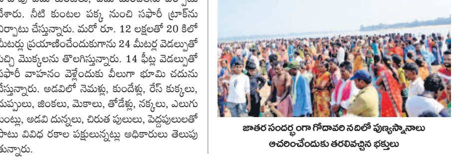
జాతర సందర్భంగా గోదావరి నదిలో పుణ్యస్నానాలు ఆచరించేందుకు తరలివచ్చిన భక్తులు

కోటపల్లి, నవంబర్ 15 : కోటపల్లి మండలం జనగామ గ్రామం లోని మదన పోచమ్మ జాతర శుభ్రవారం వైభవంగా ప్రారంభ మైంది. జనగామ నుంచి అమ్మవార్లను ఊరేగింపుగా పాఠశాల సమీపంలోని చంద్రకోట ఉత్తరవాహిణికి తీసుకువచ్చారు. అక్కడ అమ్మవార్లకు జలాభిషేకాలు నిర్వహించారు. చుట్టు పక్క గ్రామాలు నుంచి భక్తులు పెద్ద సంఖ్యలో తరలివచ్చి గోదావరి నదీలో పుణ్య స్నానాలు ఆచరించారు. అప్పే పూజలు చేశారు. నేడే అమ్మవారి రథోత్సవం, ఆదివారం అమ్మవార్లకు బోనాల సమర్పణతో జాతర ముగియనున్నట్లు నిర్వాహకులు తెలిపారు.