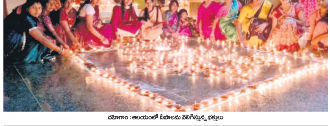
దహగాం : ఆలయంలో దీపాలను వెలిగిస్తున్న భక్తులు