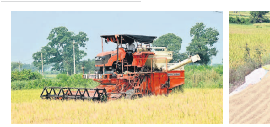
వడ్డనపల్లిలో వరి కోతలు