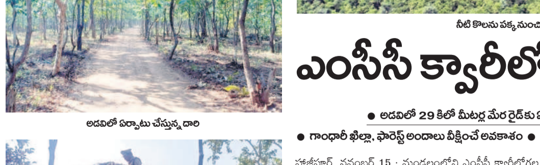
అడవిలో ఏర్పాటు చేస్తున్న దారి