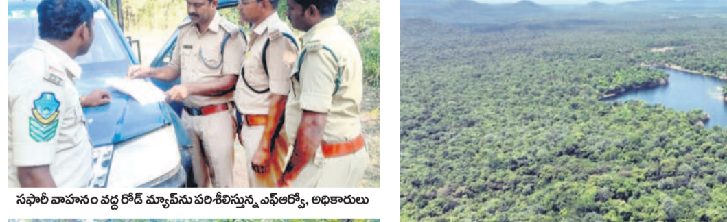
సఫారీ వాహనం వద్ద రోడ్ మ్యాప్ ను పరిశీలిస్తున్న ఎస్.ఆర్.ఎస్. అధికారులు