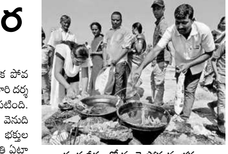
గండ దీపంలో నూనె పోస్తున్న భక్తులు