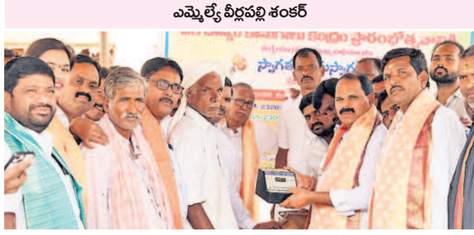
అమ్మల్నే వీధిపల్లి శంకర్

షాద్ నగర్, నవంబర్ 15: రైతులు ధాన్యానికి విక్రయించేందుకు నాణ్యత ప్రమాణాలను పాటించి ప్రభుత్వ మద్దతు ధరను పొందాలని అమ్మల్నే వీధిపల్లి శంకర్ రైతులకు సూచించారు. శుక్రవారం శేకంపేటలో కొత్త పంట పీచిపిఎస్ అధ్యక్షులతో పద్ద కొనుగోలు కేంద్రాన్ని ప్రారంభించిన ఆనంతరం మాట్లాడారు. గ్రామాల రైతులు దళారులను ఆశ్రయించి తక్కువ ధరకు తమ పంటను అమ్ముకోవడం సూచించారు. ఈ యేడు సన్న పద్దకు అదనంగా రూ. 500 బోనస్ ప్రభుత్వం చెల్లిస్తున్న విషయాన్ని రైతులు గ్రహించాలని చెప్పారు. త్వరలోనే రైతు భరోసా నిధులు రైతుల ఖాతాల్లో జమపూతాయనారు. రైతుల సమస్యలపై సంబంధిత శాఖ అధికారులు స్పందించాలని సూచించారు. కార్యక్రమంలో మండల అధికారులు, ఆ పార్టీ నాయకులు పాల్గొన్నారు.