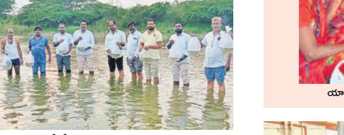
చెరువులో చేపల పెట్టెలను వదులుతున్న మృత్కృషాధారులు

షాద్ నగర్ రూరల్, నవంబర్ 15 : అన్ని వర్గాల ఆర్థిక అభివృద్ధికి కాంగ్రెస్ ప్రభుత్వం కృషి చేస్తుందని వెలిజర్ కాంగ్రెస్ నాయకులు అన్నారు. శుక్రవారం ప్రభుత్వం అందించిన ఉచిత చేప పిల్లలను గ్రామ చెరువులో వదిలారు. ఈ సందర్భంగా నాయకులు మాట్లాడుతూ.. ఉచిత చేపలను పంపిణీ చేసినందుకు ప్రభుత్వానికి కృతజ్ఞతలు తెలిపారు.