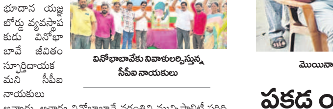
వినోభాబావకు నివాళులర్పిస్తున్న సీపీఐ నాయకులు