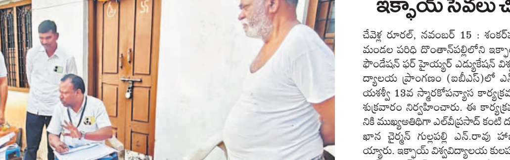
మొయినాబాద్ లోని చిలుకూరు గ్రామంలో సర్వేను పరిశీలిస్తున్న విద్యా కమిషన్ చైర్మన్ అకునూరి మురళి