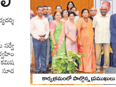
కార్యక్రమంలో పాల్గొన్న ప్రముఖులు