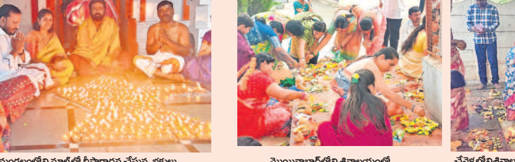
యాదారం మండలంలోని మారలో బీవారాధన చేస్తున్న భక్తులు