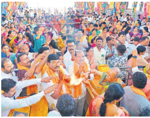
హరతి తీసుకుంటున్న భక్తులు

షాద్ నగర్, నవంబర్ 15: రైతులు ధాన్యానికి విక్రయించేందుకు నాణ్యత ప్రమాణాలను పాటించి ప్రభుత్వ మద్దతు ధరను పొందాలని అమ్మల్నే వీధిపల్లి శంకర్ రైతులకు సూచించారు. శుక్రవారం శేకంపేటలో కొత్త పంట పీచిపిఎస్ అధ్యక్షులతో పద్ద కొనుగోలు కేంద్రాన్ని ప్రారంభించిన ఆనంతరం మాట్లాడారు. గ్రామాల రైతులు దళారులను ఆశ్రయించి తక్కువ ధరకు తమ పంటను అమ్ముకోవడం సూచించారు. ఈ యేడు సన్న పద్దకు అదనంగా రూ. 500 బోనస్ ప్రభుత్వం చెల్లిస్తున్న విషయాన్ని రైతులు గ్రహించాలని చెప్పారు. త్వరలోనే రైతు భరోసా నిధులు రైతుల ఖాతాల్లో జమపూతాయనారు. రైతుల సమస్యలపై సంబంధిత శాఖ అధికారులు స్పందించాలని సూచించారు. కార్యక్రమంలో మండల అధికారులు, ఆ పార్టీ నాయకులు పాల్గొన్నారు.