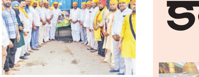
గురునానక్ జయంతి వేడుకలో పాల్గొన్న నాయకులు, సిక్కులు