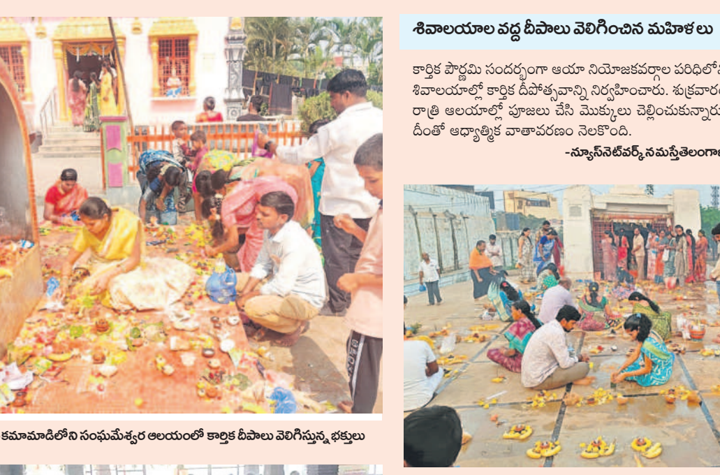
మొయినాబాద్ లోని కనకమామిడిలోని సంఘమేకర్త ఆలయంలో కార్మిక దీపాలు వెలిగిస్తున్న భక్తులు