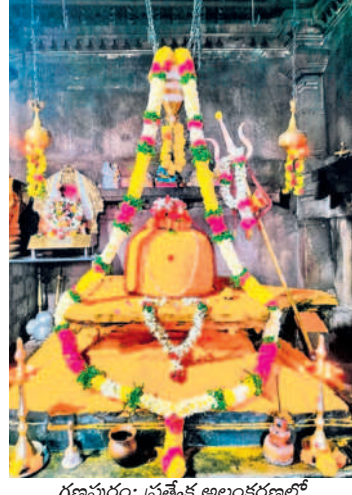
గణపూరం: ప్రత్యేక అలంకరణలో కోటగుట్ట గణపేశ్వరుడు