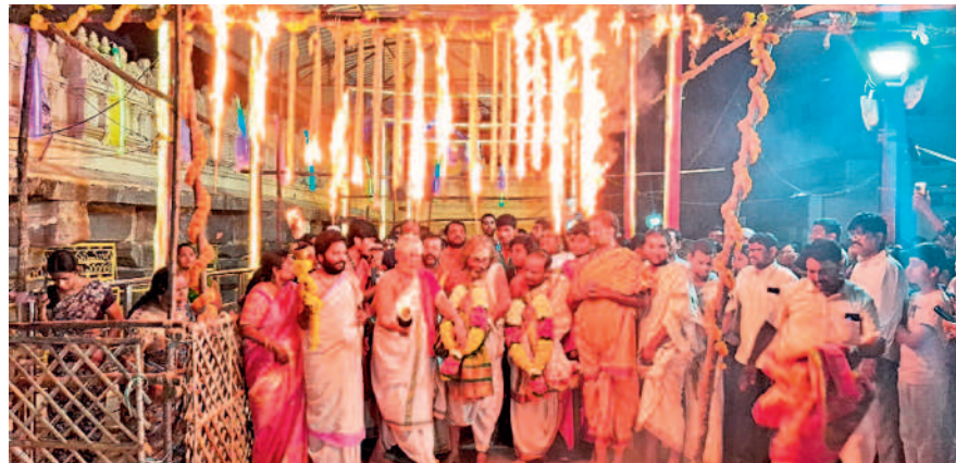
వరంగల్: భద్రకాళీ ఆలయంలో జ్వాలా తోరణం వెలిగించిన అర్చకులు, పాల్గొన్న భక్తులు