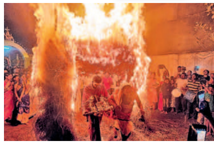
ఏటూరునాగారం: జ్వాలా తోరణం నుంచి దాటుతున్న భక్తులు