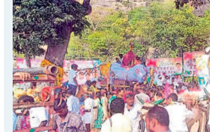
రేగొండ: జాతరలో ఎడ్ల బండ్ల ప్రదర్శనలు

కాశ్యపం, నవంబర్ 15 : పవిత్ర కార్తిక పౌర్ణమి పర్యవేక్షణలో శుభవారం జరుపుకొన్నారు. వేకువజాము నుంచే భక్తజనంతో ఆలయాలన్నీ పోటితగా, సాయంత్రం వేళ ప్రముఖ క్షేత్రాలతో పాటు ఊరూరూరూ కార్తిక దీపాల వెలుగులతో శోభిల్చాయి. హనుమకొండలోని వారిశ్రేణి వేయిస్తంభాల రుద్రేశ్వరాలయం, భద్రకాళీ, ఐనవోలు మల్లికార్జునస్వామి ఆలయం, పాలకుర్తిలోని సోమేశ్వరాలయం, కాశ్యపం-ముక్తేశ్వరాలయం సహా అన్ని ఆలయాలలో ఉదయం నుంచే దర్శనం కోసం బారులు తీరారు. రుద్రాభిషేకంతో పాటు ప్రత్యేక పూజలు నిర్వహించగా అంతటా సందడి కనిపించింది. ఈ సందర్భంగా ఊరి, తులసి చెట్ల వద్ద దీపాలు వెలిగించారు. అలాగే పలుచోట్ల రాత్రి వేళ లక్ష్మీ దీపాన్ని, జ్వాలా తోరణం, అఖండ జ్యోతి వెలిగించగా భక్తులు పెద్దసంఖ్యలో తరలివచ్చి దర్శనం చేశారు. అలాగే కాశ్యపంలోని కాశ్యప-ముక్తేశ్వర స్వామి వారి ఆలయం పౌర్ణమి సందర్భంగా భక్తులతో పోటితంది. ఉమ్మడి వరంగల్ నుంచే గాక ఇతర జిల్లాలు, రాష్ట్రాల నుంచి వచ్చిన వారితో త్రివేణి సంగమం పులకించింది. గోదావరి పుష్కరఫూల్ వద్ద భక్తులు పుణ్యస్నానాలు చేసి నదీమాతకు దీపాలు వదిలి, సైకత లింగాలను పూజించారు. కార్తిక మాసం పౌర్ణమి రోజున ఆలయానికి ఒకే రోజు రూ.9 లక్షల ఆదాయం సమకూరింది. ఉదయం 9 గంటలకు ఐదు కలశాల్లో నదీ జలాలు తీసుకొచ్చి స్వామి వారికి ప్రత్యేక అభిషేకాలు నిర్వహించగా, మధ్యాహ్నం 12 గంటలకు శివకల్యాణం జరిపించారు. అలాగే సత్యనారాయణ వ్రతాలతో పాటు ఆలయ ఆవరణలోని ఉసిరి, మారేడు చెట్లకు మహిళలు లక్ష వత్తులు, లక్ష ముగ్గులతో దీపాలంకరణ చేశారు. సాయంత్రం నడి మాతకు హారతి ఇచ్చారు.