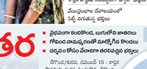
వేయిస్తంభాల దేవాలయంలో సెల్ఫీ దిగుతున్న భక్తులు