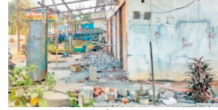
బండ్ల రులపల్లి రోడ్డుకు ఎడమ వైపున 45 ఫీట్లకు చేసిన మార్పు

ములుగు, నవంబర్ 15 (నమస్తే తెలంగాణ) : నిబంధనలకు పాతరపెట్టిన అధికారులు ఇప్పటికే రోడ్డు విస్తరణలో పలువురి గృహాలకు నష్టం వాటిల్లుతున్నది. ఇందుకు నిదర్శనమే ములుగు జిల్లా కేంద్రంలోని బండ్ల రులపల్లి రోడ్డు విస్తరణ చురుకు ఉదాహరణ. ప్రభుత్వం దావాన ఎదురుగా ఉన్న బండ్ల రులపల్లి రోడ్డును నాలుగు లేన్లుగా విస్తరించేందుకు ప్రభుత్వం రూ.8 కోట్ల నిధులతో ప్రణాళికలు రూపొందించింది. గత సెప్టెంబర్ 12న మంత్రి సీతక్క, మహబూబాబాద్ ఎంపీ బండ్ల రులపల్లి జిల్లా కలెక్టర్ కలిసి అభివృద్ధి పనులకు శంకుస్థాపన చేశారు. అయితే అధికారులు రోడ్డు నిలబడే లేన నుంచి రెండు వైపులా నూనూనగా విస్తరించాల్సి ఉంది. అయితే పక్కపాత దోరణితో కుడి వైపు 40 ఫీట్ మేరకు, ఎడమ వైపు 45 ఫీట్ వరకు