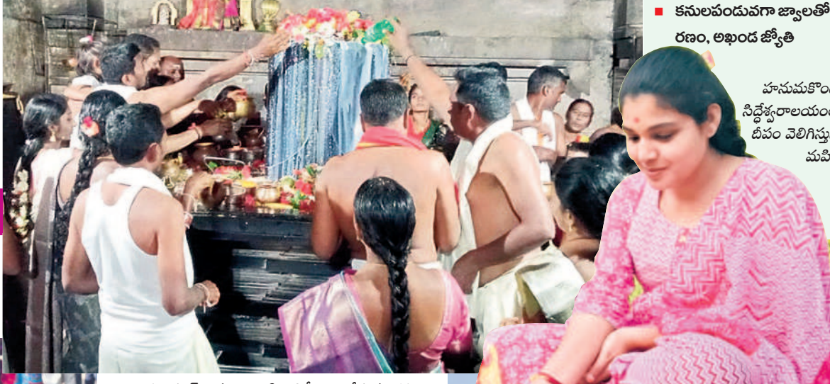
వెంకటాపూర్: శివలింగానికి అభిషేకాలు చేస్తున్న భక్తులు

కాశ్యపం, నవంబర్ 15 : పవిత్ర కార్తిక పౌర్ణమి పర్యవేక్షణలో శుభవారం జరుపుకొన్నారు. వేకువజాము నుంచే భక్తజనంతో ఆలయాలన్నీ పోటితగా, సాయంత్రం వేళ ప్రముఖ క్షేత్రాలతో పాటు ఊరూరూరూ కార్తిక దీపాల వెలుగులతో శోభిల్చాయి. హనుమకొండలోని వారిశ్రేణి వేయిస్తంభాల రుద్రేశ్వరాలయం, భద్రకాళీ, ఐనవోలు మల్లికార్జునస్వామి ఆలయం, పాలకుర్తిలోని సోమేశ్వరాలయం, కాశ్యపం-ముక్తేశ్వరాలయం సహా అన్ని ఆలయాలలో ఉదయం నుంచే దర్శనం కోసం బారులు తీరారు. రుద్రాభిషేకంతో పాటు ప్రత్యేక పూజలు నిర్వహించగా అంతటా సందడి కనిపించింది. ఈ సందర్భంగా ఊరి, తులసి చెట్ల వద్ద దీపాలు వెలిగించారు. అలాగే పలుచోట్ల రాత్రి వేళ లక్ష్మీ దీపాన్ని, జ్వాలా తోరణం, అఖండ జ్యోతి వెలిగించగా భక్తులు పెద్దసంఖ్యలో తరలివచ్చి దర్శనం చేశారు. అలాగే కాశ్యపంలోని కాశ్యప-ముక్తేశ్వర స్వామి వారి ఆలయం పౌర్ణమి సందర్భంగా భక్తులతో పోటితంది. ఉమ్మడి వరంగల్ నుంచే గాక ఇతర జిల్లాలు, రాష్ట్రాల నుంచి వచ్చిన వారితో త్రివేణి సంగమం పులకించింది. గోదావరి పుష్కరఫూల్ వద్ద భక్తులు పుణ్యస్నానాలు చేసి నదీమాతకు దీపాలు వదిలి, సైకత లింగాలను పూజించారు. కార్తిక మాసం పౌర్ణమి రోజున ఆలయానికి ఒకే రోజు రూ.9 లక్షల ఆదాయం సమకూరింది. ఉదయం 9 గంటలకు ఐదు కలశాల్లో నదీ జలాలు తీసుకొచ్చి స్వామి వారికి ప్రత్యేక అభిషేకాలు నిర్వహించగా, మధ్యాహ్నం 12 గంటలకు శివకల్యాణం జరిపించారు. అలాగే సత్యనారాయణ వ్రతాలతో పాటు ఆలయ ఆవరణలోని ఉసిరి, మారేడు చెట్లకు మహిళలు లక్ష వత్తులు, లక్ష ముగ్గులతో దీపాలంకరణ చేశారు. సాయంత్రం నడి మాతకు హారతి ఇచ్చారు.