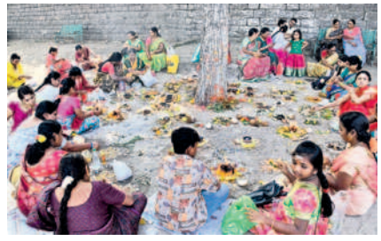
వేయిస్తంభాల దేవాలయంలో పూజలు చేస్తున్న భక్తులు