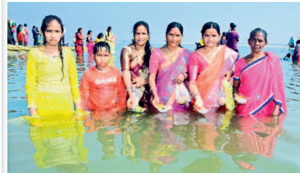
కాశ్యపం: గోదావరిలో దీపాలను వదులుతున్న భక్తులు