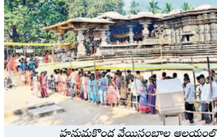
హనుమకొండ వేయిస్తంభాల ఆలయంలో క్యూలో భక్తులు