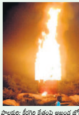
పాలకుర్తి: క్షీరగిరి క్షేత్రంపై అఖండ జ్యోతి