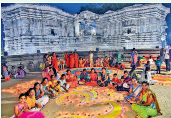
హనుమకొండలోని వేయిస్తంభాల దేవాలయంలో ముగ్గులు వేసి, ఓం ఆకారంలో దీపాలు వెలిగిస్తున్న భక్తులు