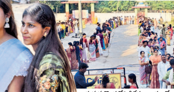
హనుమకొండలోని సిద్దేశ్వరాలయంలో కార్తిక పౌర్ణమి సందర్భంగా క్యూలో భక్తులు