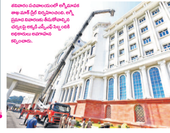
శనివారం సవియాలంలో అగ్నిమాపక శాఖ మార్కెట్ నిర్వహించింది. అగ్ని ప్రమాద నివారణకు డి.ఎస్.ఆర్.ఎస్. చర్యలపై అగ్ని సేవల నిపుణుల అధికారులు అలవాసన కల్పించారు.