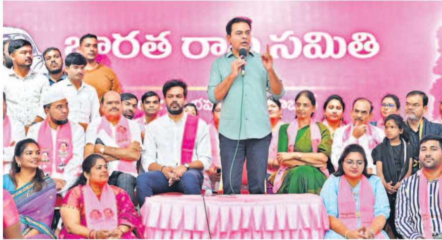
శనివారం తెలంగాణ భవన్లో మూడూడుతున్న బీఆర్ఎస్ వర్కౌన్ ప్రసిడెంట్ కేటీఆర్, చిత్తూరులో ఎమ్మెల్యే సబితా ఇంద్రారెడ్డి, బీఆర్ఎస్ నేతలు