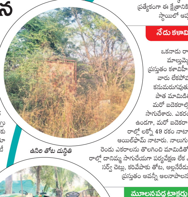
ఉసిరి తోట దుస్థితి