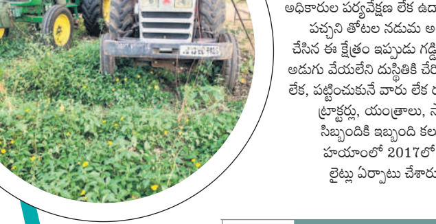
వృధాగా మారిన ట్రాక్టర్లు