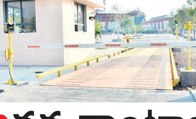
తూనికలు కొలతల శాఖ పంపిస్తున్నట్లు..?