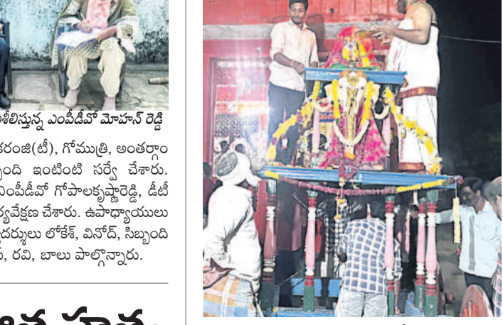
చిన్నరథంపై గజ వాహనాన్ని ఉదోగిస్తున్న భక్తులు

జైనేడ్, నవంబర్ 17 : జైనేడ్ లోని శ్రీ లక్ష్మీనారాయణ స్వామి ఆలయ ప్రవేశోత్సవాలలో భాగంగా ఆదివారం చిన్న రథంపై గజవాహనం సేవ ఉదోగిస్తున్న నిర్వహించారు. ఆలయ ఆవరణలో చిన్న రథంపై గజ వాహనాన్ని పురవీధుల గుండా శోభాయాత్ర నిర్వహించారు. దారి పొడవును భక్తులు రథం వద్ద పూజలు చేసి స్వామిని దర్శించుకున్నారు.