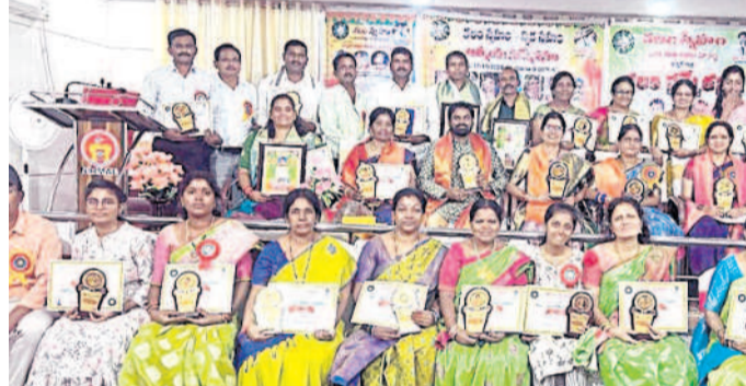
కవి సమ్మేళనంలో పాల్గొన్న కవులు