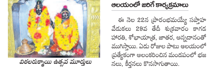
విరలేశ్వరాలయం ఉత్సవ మూర్తులు

కుటీర్, నవంబర్ 17 : కుటీర్ లో మరో పండలిపురంగా వెలుగొందుతున్న విరలేశ్వర ఆలయంలో ఈ నెల 29వ నిర్వహించే జాత ఖ్యోలో తరలివస్తారు. సుమారు 50 క్లింబాకార రకు ఆలయ కమిటీ అధ్యక్షులతో ఏర్పాటు ముప్పురం చేశారు. ఈ నెల 22న సప్తహ వేడుకలు ప్రారంభిస్తారు. జాత సంధర్భంగా మందిరాలను రంగులతో ఆలంకరించారు.