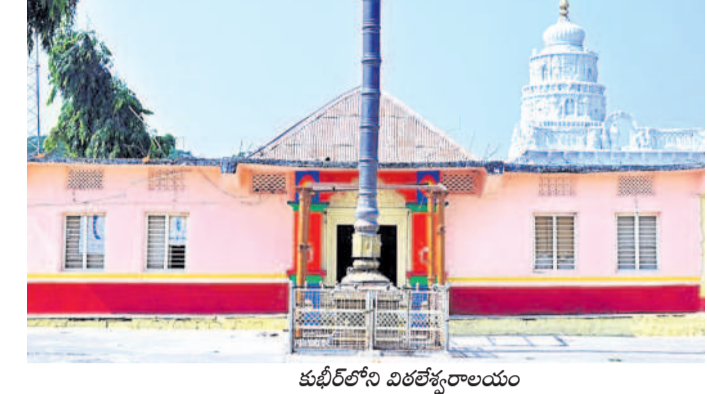
కుటీర్ లోని విరలేశ్వరాలయం

కుటీర్, నవంబర్ 17 : కుటీర్ లో మరో పండలిపురంగా వెలుగొందుతున్న విరలేశ్వర ఆలయంలో ఈ నెల 29వ నిర్వహించే జాత ఖ్యోలో తరలివస్తారు. సుమారు 50 క్లింబాకార రకు ఆలయ కమిటీ అధ్యక్షులతో ఏర్పాటు ముప్పురం చేశారు. ఈ నెల 22న సప్తహ వేడుకలు ప్రారంభిస్తారు. జాత సంధర్భంగా మందిరాలను రంగులతో ఆలంకరించారు.