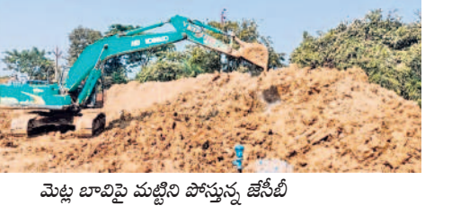
మెట్ల బావిపై మట్టిని పోస్తున్న జేసీబీ

పోయింది. ఈ క్రమంలో అక్కడ మెట్ల బావి ఉన్న విషయం ఉన్నా అధికారులకు చెప్పకుండా ఇష్టానుసారం మట్టి పోయడంతో బావి కనుమరుగైంది. అయితే ఈ మెట్ల బావి బాట సాగులు, గొర్రు, పశువుల కాపర్ల దాడులకు తీర్చిదిద్దుకు ఉపయోగపడేది ప్రజలు చెబుతున్నారు. ఈ బావి నీళ్లు తయ్యంగా ఉంటాయని పేర్కొంటున్నారు. చేదు కనీ ఆవసరం లేకుండా నేరుగా బావిలోకి దిగి బిందెలతో తెచ్చుకునేందుకు వీలుగా రాళ్ల మెట్లతో సుమారు 150 ఏళ్ల క్రితం ఈ బావిని నిర్మించారు. 20 ఏళ్ల క్రితం వరకు ఆ బావి మట్టిలో వెళ్లి వారు బావిలోకి దిగి నీళ్లు తెచ్చుకునే వారు. ఈ బావిలో నిన్ను మొన్నటి వరకు కూడా నీటితో నిండి ఉండేది. అయితే దీని పక్క సుంబి ఎస్పీఎస్సీ కెనాల్ ను ఎత్తగా నిర్మించడంతో ఈ బావి ఎన్ సాచ్, కెనాల్ ను కలుపుతూ ఉండేది. ములుగు జిల్లా ఏర్పడిన తర్వాత అప్పటి కలెక్టర్ గట్టమ్మ గుడి ప్రాంతంతో పాటు మెట్ల బావిని సైతం అభివృద్ధి చేసి పర్యాటక ప్రాంతంగా తీర్చిదిద్దడానికి వెళ్ళడం వచ్చింది. అయితే అధికారులు నిర్లక్ష్యం, పర్యవేక్షణ లోపంతోనే మెట్ల బావి రోడ్డు విస్తరణ పనుల్లో కనుమరుగైంది స్థానికులు ఆరోపిస్తున్నారు.