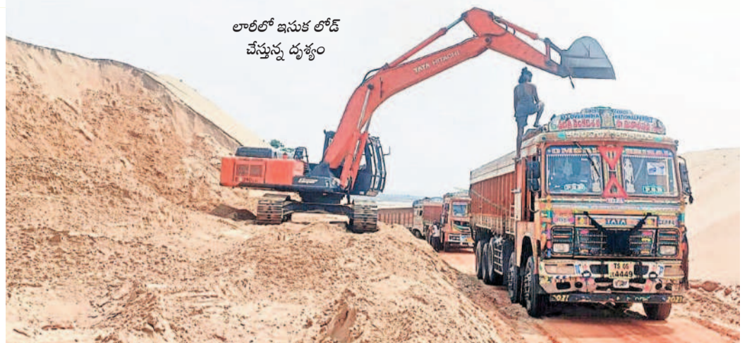
లాబీలో ఇసుక లోడ్ చేస్తున్న దృశ్యం

గోదావరి సాక్షిగా ఇసుక దోపిడీ జయశంకర్ భూపాలపల్లి, నవంబర్ 17 (నమస్తే తెలంగాణ) : గోదావరి సాక్షిగా ఇసుక దోపిడీ కొనసాగుతున్నా ఉంది. కాంట్రాక్టు అందడంతో ఎలాంటి ఆన్ లైన్ బుకింగ్ లేకుండానే ఇసుక తరలుతున్నది. అలాగే క్యారీ వద్ద అదనపు బజెట్ దండాకు అడ్డు అడుపు లేకుండా పోతున్నది. ఓవర్ లోడ్, జోర్ దండాలో పోలీసులకు పట్టుబడుతున్న లాబీ ఇందుకు నిదర్శనం. లాబీలో అదనంగా ఒక బజెట్ ఇసుక నింపి తరూ. 7,200 వసూలు చేస్తున్నట్లు పలు వార్తలు లాబీ యజమానులే పేర్కొంటున్నారు. కాంట్రాక్టు కూటమి కట్టి ఇసుక దోపిడీ తగ్గించాలన్నారు. ఆన్ లైన్ బుకింగ్ లేకుండానే ఇసుకను తరలిస్తున్నారంటే క్యారీ వద్ద అవినీతి ఏ మేరకు జరుగుతుందో అవగతమవుతుంది. పోలీసులు ఇటీవల పట్టుకుంటున్న లాబీ