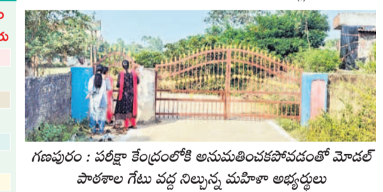
గణపూర్ : పరీక్షా కేంద్రంలోకి అనుమతించకపోవడంతో మోడల్ పాఠశాల గేటు వద్ద నిల్చున్న మహిళా అభ్యర్థులు

క్షక హాజరుకావాల్సి ఉంది. కాగా ఉదయం 8:30, మధ్యాహ్నం 3:30, 6:00 మంది అభ్యర్థులు పరీక్ష రాయేరు. ఉదయం నిర్వహించిన పరీక్షకు హాజరైన అభ్యర్థుల్లో 176 మంది మధ్యాహ్నం పరీక్ష రాయేరు. పరీక్షార్థులకు కేంద్రాల్లో ఎలాంటి ఇబ్బందులు కలుగకుండా అధికారులు ఏర్పాటు చేశారు. ఆర్టీసీ ప్రత్యేక బస్సులు నడపగా, పోలీసులు సింబల్ వద్ద 144 సిక్సర్ అవులు చేయడంతో పాటు బందోబస్తు నిర్వహించారు. పరీక్షా కేంద్రాలను ఆయన జిల్లాల కలెక్టర్లు, ఇతర అధికారులు పరిశీలించారు. కాగా, జయశంకర్ భూపాలపల్లి జిల్లా గణపూర్ మండలం కేంద్రంలోని మోడల్ పాఠశాలలో పరీక్ష రాయేరు మహిళా అభ్యర్థులపై ఉన్నత పాఠశాలకు చేరుకుంది. విషయం తెలుసుకుంటే మోడల్ న్యూస్ పేపర్ వెళ్లి సమయం మించి పోవడంతో లోనికే అనుమతించలేదు. దీంతో చేసేదేమీ లేక ఇంటికి తిరిగి వెళ్లిపోయింది.