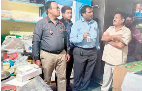
నకిలీ డాక్టర్ నిర్వహిస్తున్న క్లినిక్ లలో తనిఖీలు చేస్తున్న వైద్య మండలి అధికారులు