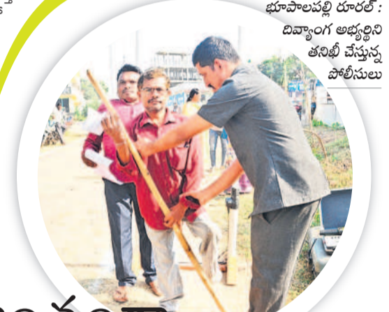
భూపాలపల్లి రూల్ : దివ్యాంగ అభ్యర్థిని తనిఖీ చేస్తున్న పోలీసులు

మెదపడం లేదనే ఆరోపణలు వెల్లువెత్తుతున్నాయి. ఒక నెలలోనే సుమారు 20 లాబీలు ఓవర్ లోడ్ తో పోలీసులకు పట్టుబడ్డాయి. మరో లాబీ ఎలాంటి ఆన్ లైన్ బుకింగ్ లేకుండా ఇసుకను తీసుకువెళ్తున్న సుంబి రూ. 7,200 వసూలు చేస్తున్నట్లు లాబీ యజమానులు ఆరోపిస్తున్నారు. మరో అదనపు బజెట్ కూడా రూ. 2 వేలు వసూలు చేస్తున్నట్లు చెబుతున్నారు. ఒక బజెట్ లో 5 టన్నుల చొప్పున ప్రతి క్యారీలో 16 రెండు బజెట్లు (10 టన్నులు) ఇసుక తరలి పోతున్నది. ఇలా రోజుకు 200 లాబీలు సుంబి సుమారు రూ. 18 లక్షల సుంబి రూ. 20 లక్షల వరకు అదనపు అదాయాన్ని అక్రమంగా సంపాదిస్తున్నారు. ఇందులో టీఎస్ఎంసీల అధికారులకు వాటాలు ముందుగా న్యాయని, అందుకు వల్లే వారు నోరు