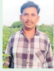
- యాదగిరి, రైతు, పానాలి, తాంస మండలం

ఎన్నికలప్పుడు రైతులను కింద ఎకరానికి రూ.15 వేలు ఇస్తామని ప్రకటించిన కాంగ్రెస్ నాయకులు ఇప్పుడు దాట వేస్తున్నారు. నేను మూడేకరాల్లో పత్తి వేకా. దిగుబడి సరిగా లేక, మద్దతు ధర రాక వంటను తీసివేసి యాసంగిలో శనగ సాగు చేస్తున్నారు. సాగు కోసం అధిక వడ్డీకి అప్పులు తీసుకోవచ్చు. బీఆర్ఎస్ ప్రభుత్వం అధికారంలో ఉన్నప్పుడు రైతులను డబ్బులు వచ్చేవి. ఇప్పుడు రెండు సీజన్లు అయినా పైసల జాడలేదు.