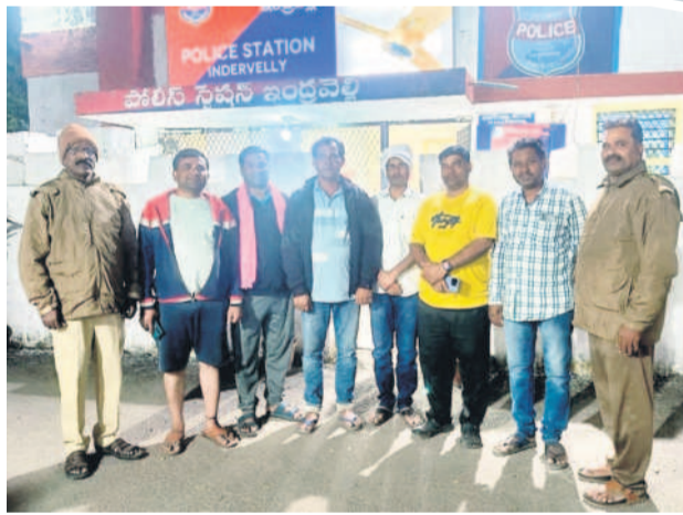
ఇంద్రవైల్లె పోలీస్ స్టేషన్లో బీఆర్ఎస్ నాయకులు

భాగంగా విత్తనాలు, ఎరువుల కోసం ఆర్థిక ఇబ్బందులు వడే రైతులకు రైతులకు డబ్బులు ఉపయోగపడేవి. కేసీఆర్ ప్రభుత్వం ఎకరాకు రూ.5 వేల చొప్పున వానకాలం, యాసంగి సీజన్లకు రూ.10 వేలను పంపిణీ చేసింది. సీజన్ వారీ ముందుగానే డబ్బులు రైతుల బ్యాంకు ఖాతాల్లో జమ అయ్యాయి. దీంతో సీజన్లకు ముందుగానే విత్తనాలు, ఎరువులను కొనుగోలు చేసే సకాలంలో విత్తనాలు వేసారు. పంటలకు ఎరువులను వేయడంలో దిగుబడులు అశాశన కంగా ఉండేవి. విత్తనాలు, ఎరువుల దుకాణదారులు రైతులకు డబ్బులు వస్తాయనే నమ్మకంతో ఉద్దేశ ఇచ్చే వారు. కేసీఆర్ ప్రభుత్వం ప్రారంభించిన రైతులకు పథకం అన్నదాతలకు అందగా నిలిచింది. కేంద్ర ప్రభుత్వం రైతులకు పథకాన్ని కాపీ కొట్టి కిసాన్ సమ్యక్ యోజన అనే పథకాన్ని ప్రారంభించింది. దేశంలోని పలు రాష్ట్రాలకు రైతులకు పథకం అంద ర్పంగా నిలిచింది.