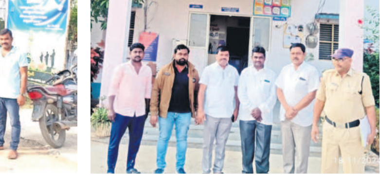
గుడిపాత్నూర్లో బీఆర్ఎస్ నాయకుల అరెస్టు