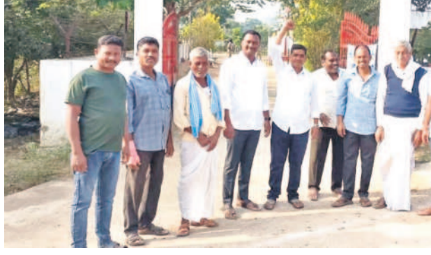
పోలీస్ స్టేషన్ ఎదుట నిరసన తెలుపుతున్న నాయకులు