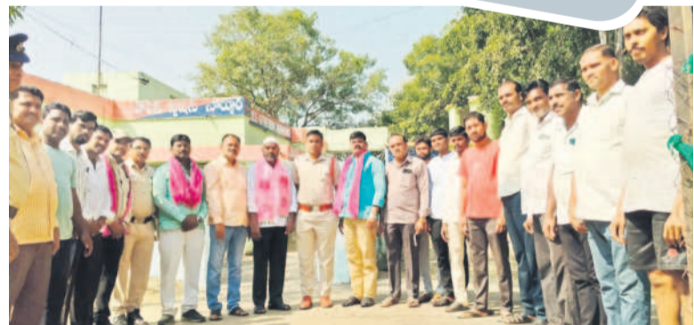
నార్సూర్ పోలీస్ స్టేషన్లో అరెస్టు అయిన బీఆర్ఎస్ నాయకులు