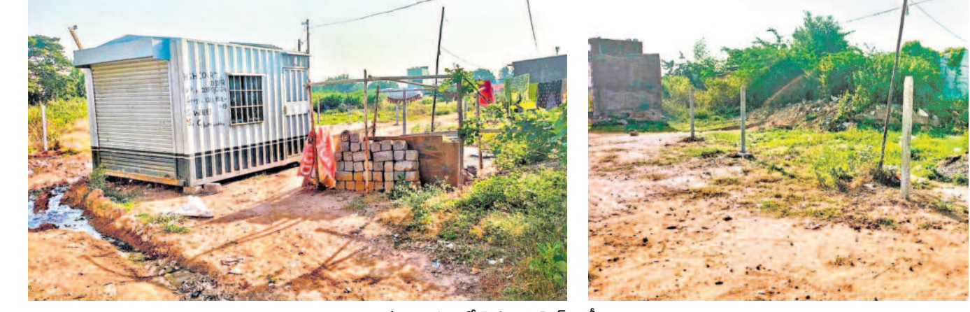
సర్కారు భూమిలో వెసిన కంటైనర్.. కడీలు

డిప్యూటీ కమిషనర్ పి.ఎం.ఎల్ సీటీబియూలో : హెచ్ఎండ్ఎస్లో శాశ్వత, డిప్యూటీ కమిషనర్ ఆధికారుల మధ్య ఉన్న లుకలుకలు బయటపడుతున్నాయి. ఇప్పటికే డిప్యూటీ కమిషనర్ ఆధికారులతో హెచ్ఎండ్ఎస్ నియంత్రణను శాశ్వత సిబ్బంది అనుబంధం ఉండగా, తాత్కాలిక జరుగుతున్న కొన్ని సంఘటనలతో ఇరు ఉద్యోగుల మధ్య ఉన్న వైరుధ్యాలు వెలుగులోకి వస్తున్నాయి. దీంతో కొందరు డిప్యూటీ కమిషనర్ ఆధికారులను సిబ్బందిని నియంత్రించే ధోరణిలో వ్యవహరిస్తున్నారని సమాచారం. కొన్ని వివాదాస్పదమైన అంశాలు వెలుగులోకి వస్తున్నాయనే అనుమానంతో కీలక బాధ్యతలకు దూరంలో ఉండటం వల్ల అనేక అసౌకర్యం కలుగుతుంది.