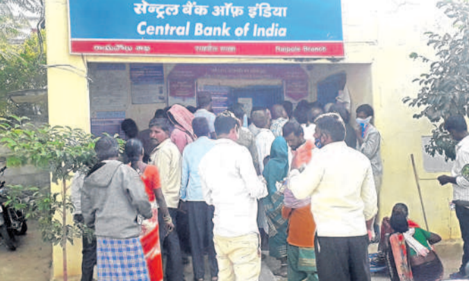
రాయపోల్ సెంట్రల్ బ్యాంకు ఎదుట ఖాతాదారులు