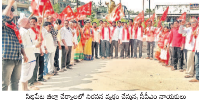
సిద్దిపేట జిల్లా చేర్యాలలో నిరసన వ్యక్తం చేస్తున్న సీపీఎం నాయకులు