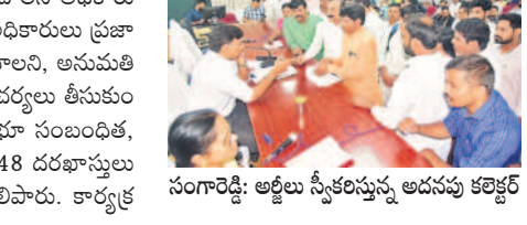
సంగారెడ్డి: అర్జీలు స్వీకరిస్తున్న అదనపు కలెక్టర్

సిద్దిపేట కలెక్టర్ మనుచౌదరి సిద్దిపేట కలెక్టరేట్, నవంబర్ 18: అర్జీదారుల సమస్యలు పరిష్కరించేందుకు ప్రత్యేక చొరవ చూపాలని సిద్దిపేట కలెక్టర్ మనుచౌదరి అధికారులను ఆదేశించారు. సోమవారం సిద్దిపేట సమీకృత జిల్లా కార్యాలయ సముదాయంలోని సమావేశ మందిరంలో ప్రజావాణి నిర్వహించారు. జిల్లా నలుమూలల నుంచి వచ్చిన అర్జీదారుల నుంచి కలెక్టర్ దరఖాస్తులు స్వీకరించారు. ఈ సందర్భంగా ఆయన మాట్లాడుతూ సమస్యల పరిష్కారం కోసం జిల్లాలోని వివిధ ప్రాంతాల నుంచి ప్రజలు వస్తారన్నారు. ఫిర్యాదులపై సమాహారంగా వ్యవహరించడంతో పాటు సమస్యల పరిష్కారానికి అధిక ప్రాధాన్యం ఇవ్వాలన్నారు. అర్జీలను పెండింగ్లో పెట్టకుండా ఎప్పటికప్పుడూ పరిష్కరించాలని అధికారులను ఆదేశించారు. జిల్లా అధికారులు ప్రజావాణికి విధిగా హాజరు కావాలని, అనుమతి లేకుండా ఏదైనా కార్యక్రమం చేయకుండా పాటించి హెచ్చరించారు. భూ సంబంధిత, ఇండ్లు, అసరా పింఛన్లు 48 దరఖాస్తులు వచ్చినట్లు అధికారులు తెలిపారు. కార్యక్రమంలో