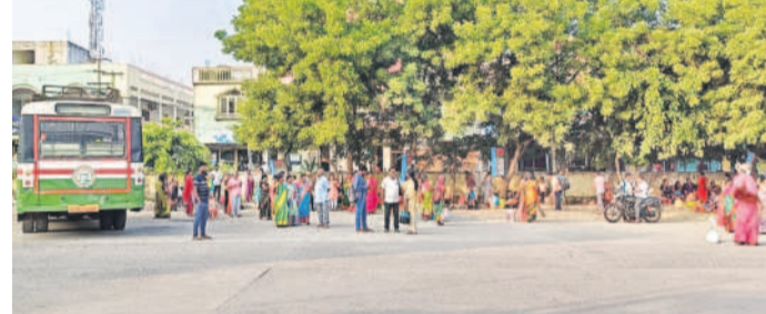
చెట్లకింద బస్సుల కోసం వేచి చూస్తున్న ప్రయాణీకులు

ఇబ్దుదులు పడుతున్న ప్రయాణీకులు, అర్జీల ఉద్యోగులు రవాణాశాఖ మంత్రి పాస్యం ప్రభాకర్ ఇలాఖాలో ఇది పరిష్కరించాలి హుస్సేబాద్, నవంబర్ 18: సిద్దిపేట జిల్లా హుస్సేబాద్ అర్జీల బస్టాండ్ అధునీకరణ పనుల్లో జాప్యం కారణంగా ప్రయాణీకులు తీవ్ర ఇబ్బందులు పడుతున్నారు. బస్టాండ్లో అధునీకరణ పనుల్లో జాప్యం జరగడం ఏమిటో బస్టాండ్ ఫాలోఫామీలను అధికారులు మార్చారు. దీంతో బస్టాండ్ అవరలోని చెట్ల ఫాలోఫామీలూ మారాయి. ఆరు నెలల క్రితం హుస్సేబాద్ బస్టాండ్ అధునీకరణ పనులకు ప్రభుత్వం రూ.2కోట్లు కేటాయింది. ఇందులో భాగంగా అదనంగా ఫాలోఫామీలు, మరుగుదొడ్ల నిర్మాణం, బస్టాండ్ కు సీలింగ్, అవరలో సీసీ వేసే పనులు చేయాల్సి ఉంది. ఇందులో కొన్ని పనులు పూర్తయినప్పటికీ మరీకొన్ని పనులు పూర్తి చేయడంలో కాంట్రాక్టర్ తాత్కాలిక చేస్తున్నారు. బస్టాండ్ కు సీలింగ్ వేసే పనిలో భాగంగా ఫాలోఫామీల వద్ద కర్రలు అమర్చారు. దీంతో బస్టాండ్లో ప్రయాణీకులు వెళ్లే అవకాశం గానీ, బస్సులు ఫాలోఫామీపై