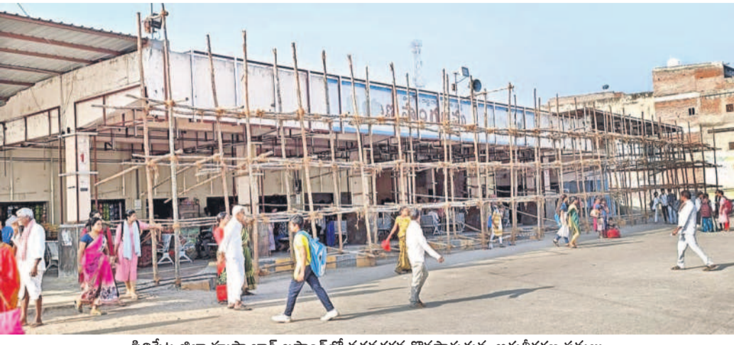
సిద్దిపేట జిల్లా హుస్సేబాద్ బస్టాండ్లో సత్సంకరణ కొనసాగుతున్న అధునీకరణ పనులు