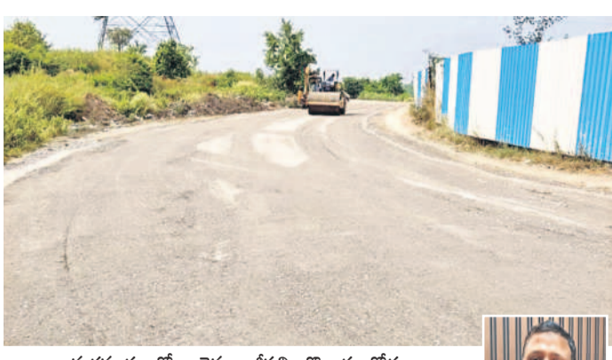
మరమ్మత్తులతో బాగైన ఖాజీపల్లి-బొల్లారం రోడ్డు