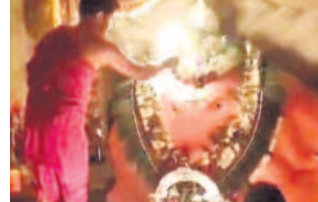
రేజింజర్ నిధినినాయకడికి హారతి ఇస్తున్న అర్చకుడు

జహీరాబాద్, నవంబర్ 18: న్యాయకేంద్ర మండలంలోని రేజింజర్ నిధినినాయక ఆలయం భక్తులతో సందడిగా మారింది. కార్తీక సోమవారంతోపాటు సంకష్టహర చక్రవర్తి దినోత్సవాన్ని పురస్కరించుకొని ఆలయంలో ఆధ్వర్యం వహించారు. బోలో నిధినినాయక మహారాజుల జై అంటూ భక్తులు నినాదాలతో ఆలయ ప్రాంగణం మార్మో గింది. అర్చకులు ఆలయంలో స్వామివారికి అర్పించి, కుంకుమార్చన, గణేశ హోమం, హారతి తదితర పూజలు నిర్వహించారు. సంకష్టహర చక్రవర్తి పూజలు నిర్వహించారు. ఈ సందర్భంగా కర్ణాటక, మహారాష్ట్ర ప్రాంతాల నుంచి భక్తులు భారీగా తరలివచ్చారు. అలయ ప్రాంగణంలోని యాగశాలలో సిద్ధి, బుద్ధి సామేత వినాయకడి కర్ణాటకలోని సిద్ధి, కనుల పండువుగా నిర్వహించారు. మండలంలోని హద్దూర్ వరసిద్ధి వినాయక ఆలయం, చీకూర్ గ్రామంలోని సిద్ధి వినాయక ఆలయంలో భక్తులు స్వామివారికి ప్రత్యేక పూజలు చేశారు. కార్యక్రమంలో అలయ గ్రామాలకు చెందిన ప్రజాప్రతినిధులు, నాయకులు, ఆలయ కమిటీ సభ్యులు పాల్గొన్నారు.