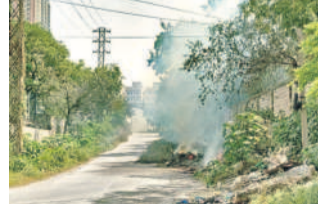
బొల్లారం పారిశ్రామిక వాడలో వ్యర్థాల కాల్చి వేయడంతో కమ్ముకున్న పొగ

బొల్లారం, నవంబర్ 18: విచ్చలవిడిగా రసాయన పరిశ్రమల ఘన వ్యర్థాలను తరచు కాల్చివేయడంపై పారిశ్రామిక వాడ ప్రజలు తీవ్ర ఆందోళన వ్యక్తం చేస్తున్నారు. సోమవారం బొల్లారం పారిశ్రామిక వాడలో గుర్తింబియని వ్యర్థాలు (ట్రాక్టర్ల ద్వారా పెద్ద ఎత్తున పోగుచేసిన రసాయన ఘన వ్యర్థాలను బహిరంగ ప్రదేశాల్లో కాల్చివేస్తున్నారు. దీంతో పారిశ్రామిక దుర్భ్రమైన నల్లని పొగలు ఆవరించడంతో జనాలు ఉక్కిరిబిక్కిరి అయ్యారు. పరిశ్రమల యాజమాన్యాల వారినార్డు ఇలా చేస్తున్నా అధికారులు పట్టణంకోసం లేదని ఆగ్రహం వ్యక్తం చేస్తున్నారు.