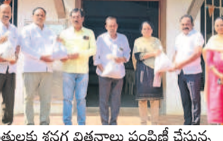
రైతులకు శుభం చిత్తనాలు పంపిణీ చేస్తున్న శాస్త్రవేత్తలు రూపొందించిన పుస్తకం

జహీరాబాద్, నవంబర్ 18: యాజమాన్య పద్ధతులు పాటించి అధిక దిగుబడి సాధించవచ్చని ఏరువాక కేంద్రం సంగంపేట శాస్త్రవేత్తలు రూపొందించిన పుస్తకం ఆవిష్కరణ. సోమవారం మొగుడంపల్లి మండల పరిధిలోని దనసిరి గ్రామంలోని రైతు వేదికలో రైతులకు యాసంగి సీజన్