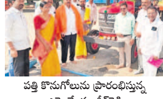
పత్తి కొనుగోళ్లను ప్రారంభిస్తున్న ఎమ్మెల్యే సంక్షేమరైతి

నారాయణఖేడ్, నవంబర్ 18: నారాయణఖేడ్ మండలం పైడిపల్లి శివారులో అక్కడి జిల్లా ఎంపీ మిల్లర్లతో సోమవారం ఎమ్మెల్యే పట్టి సంక్షేమరైతి పత్తి కొనుగోళ్లను ప్రారంభించారు. ఈ సందర్భంగా ఆయన మాట్లాడుతూ పత్తి కొనుగోళ్లలో పెద్ద ఎత్తున పత్తి పండిస్తున్న రైతులకు ఈ అవకాశాన్ని సద్వినియోగం చేసుకోవాలని కోరారు. దశాబ్దం వల్ల రైతులు నష్టపోవడనే ఉద్దేశంతోనే ప్రభుత్వం పత్తి కొనుగోళ్లు కేంద్రాలను ప్రారంభించి మద్దతు దర కల్పిస్తున్నట్లు తెలిపారు.