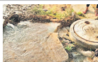
వి తక్షణమే నీటి వృధాను అరికట్టాలని ప్రజలు కోరుతున్నారు.

బొల్లారం, నవంబర్ 18: బొల్లారం పారిశ్రామిక వాడలో కాగనీటి కోసం ఇబ్బందులు పడుతుంటే మరోవైపు మంజీరా పై లైన్ లీకేజీతో నీరు వృధాగా పోతున్నది. పారిశ్రామిక వాడలోని హనుమాన్ ఆలయం నుంచి జెనెక్స్ పరిశ్రమల వైట్ డారి చక్కన మంచులు నిర్మలై లైన్ లైన్ ద్వారా రోజూలాగా నీరు వృధాగా పోతున్నది స్థానికులు అందోళన వ్యక్తం చేస్తున్నారు. అధికారులు స్పందించాలని కోరారు.