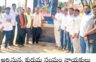
నివాళి అర్పిస్తున్న కురుమ సంఘం నాయకులు

నారాయణఖేడ్, నవంబర్ 18: నారాయణఖేడ్ లో సోమవారం స్థానిక కురుమ సంఘం ఆధ్వర్యంలో కనకదాస్ జయంతి ఉత్సవాలను నిర్వహించారు. పట్టణంలోని భోంగోండేశ్వర్ విగ్రహం వద్ద భక్త కనకదాస్ చిత్రపటానికి పూజలు చేసి మేడుకలు జరుపుకోన్నారు. అనంతరం సంఘం బాధ్యులు మాట్లాడుతూ సమావేశం వైభవంగా తెచ్చేందుకు కనకదాస్ చేసిన కృషి ఎనలేనిది గుర్తుచేశారు. ప్రతిఒక్కరూ