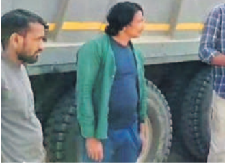
డాక్టర్ గ్రామస్థులు అడ్డుకున్న టిప్పర్ల వద్ద వివరాలు తెలుసుకుంటున్న అధికారులు

అనుమతులున్నాయని వదిలివేట్లన రెవెన్యూ అధికారులు