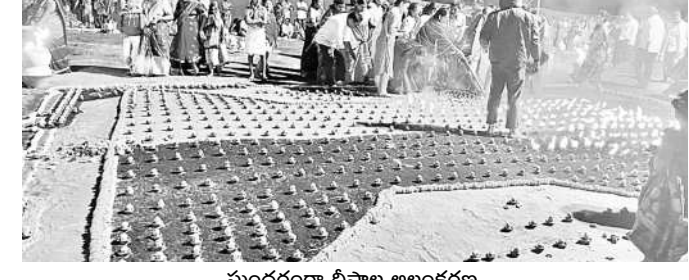
సందరంగా దీపాల అలంకరణ

అశ్వారావుపేట రూరల్, నవంబర్ 19: మండల పరిషత్లోని వినాయకపురంలోని చిలకలగండి ముఖ్యమంత్రి ఆలయ ఆవరణలో అమ్మవారికి ఏకాదశి రుద్రభిక్షం పూజలు నిర్వహించారు. సమాప్త లింగా