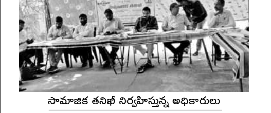
సామాజిక తనిఖీ నిర్వహిస్తున్న అధికారులు