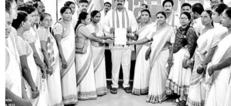
ఎమ్మెల్యే సాయిం వెంకటేశ్వర్లుకు మినకవత్తం ఇస్తున్న ఆశ వర్షార్లు

మణుగూరు టౌన్, నవంబర్ 19: ఆశ వర్షార్లకు జీతాల పెంచాలని కోరుతూ పినపాక ఎమ్మెల్యే సాయిం వెంకటేశ్వర్లు మణుగూరులోని ఎమ్మెల్యే క్యాంపు కార్యాలయంలో మంగళవారం కలిసి విన్నవించారు. సమస్యలపై వివరాలను అందించారు. ఎమ్మెల్యే సాయిం వెంకటేశ్వర్లు సుందరి పరిష్కారానికి కృషి చేస్తామని హామీ ఇచ్చారు.