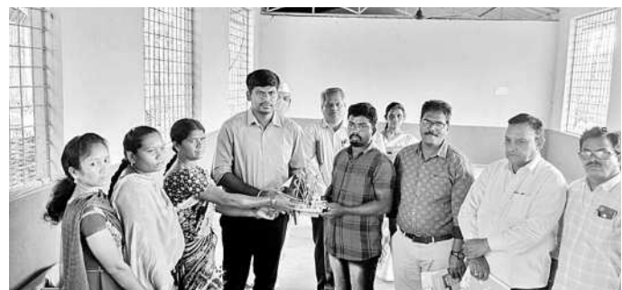
అశ్వారావుపేట రూరల్ : ఐటీడీఏ పీవోకు ధోళి ఇస్తున్న కొండరెడ్లు