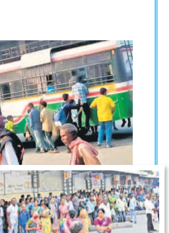
హనుమకొండలో బస్సుల కోసం ఎదురుచూస్తున్న ప్రయాణికులు