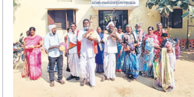
తహసీల్ కార్యాలయం ఎదుట అందోళన చేస్తున్న బేడ బుడగ జంగం కులస్తులు