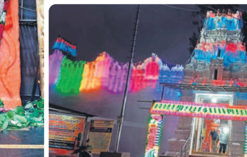
విద్యుద్దిపాలతో ముస్తాబైన ఆలయం