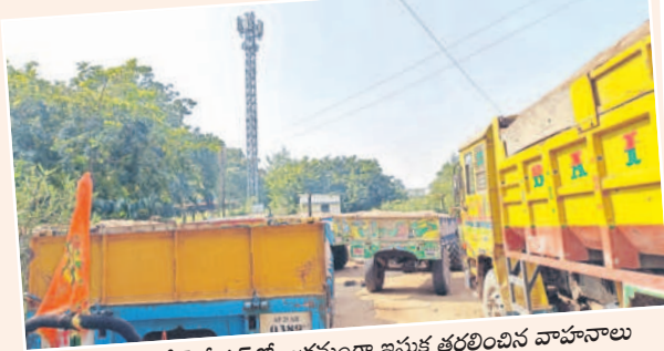
బోధన్ పోలీస్ స్టేషన్లో అక్రమంగా ఇసుక తరలించిన వాహనాలు