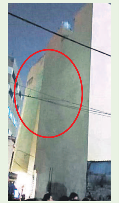
సిద్దికోనగర్లో పక్కకు ఒరిగిన భవనం