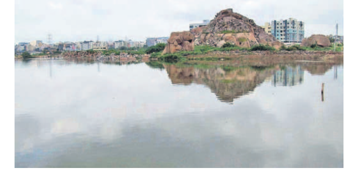
సింది. చెరువుల అభివృద్ధికి అయ్యే నిధులేవే.. అసలు ఏ మేరకు ఎలా అభివృద్ధి చేయగలమనే అంశాలపై సంబంధిత శాఖ అధికారులతో కమిషన్ అంతర్గతంగా సమావేశం నిర్వహించారు. ఆ తర్వాత చెరువుల సుందరీకరణ ముచ్చటలే పక్కన పోయింది. ఇప్పడంతా రోడ్డు, ప్రభుత్వ స్థలాల ఆక్రమణపై హైద్రా దృష్టిపెడుతోంది.