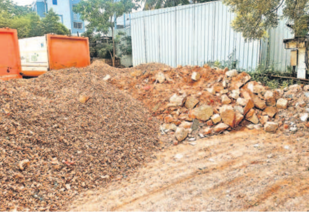
జేసీఎంసీ ఆయా ఏజెన్సీలకు వ్యర్థాల తరలింపు బకాయి పడింది. దాదాపు రూ. 7కోట్ల పైగా జేసీఎంసీ నుంచి బకాయిలు రావాల్సి ఉందని, ప్లాంట్ నిర్వహణ భారంలో కూతుకుందని ఏజెన్సీలు జేసీఎంసీకి అభిమతిం జారీ చేసేందుకు సిద్ధమవుతున్నట్లు తెలిసింది.

భవన నిర్మాణ వ్యర్థాలతో డంపింగ్ కేంద్రాలుగా ఖాళీ స్థలాలు, చెరువులు బకాయిల చెల్లింపులో జాప్యంపై గుర్తుగా ఉన్న ఏజెన్సీలు సీబీఐఎస్, నవంబర్ 19 (నమస్తే తెలంగాణ): జేసీఎంసీలో భవన నిర్మాణ వ్యర్థాల తరలింపు ప్రక్రియ గాడి తప్పిపోయింది. కూల్చి వేసిన సీ అండ్ డి (కన్స్ట్రక్షన్ అండ్ డిమాల్టిషన్) వ్యర్థాల తరలింపులో సమస్యయల్పం కొద్దొచ్చినట్లు కనబడుతున్నది. భవన నిర్మాణాల వ్యర్థాలను రీ సైకిల్ చేసే రియూజ్ (పునర్ వినియోగం)లోకి తీసుకువచ్చేందుకు కూడా నగరంలో జీడివెట్లు, పతల్లగాడ, శంషాబాద్, తూంకుంటలో నాలుగు ప్లాంట్లను ఏర్పాటు చేశారు. అయితే గడివిన కొన్ని నెలలకు, ఈ భవన నిర్మాణ వ్యర్థాల తరలింపు సజావు జరగడం లేదు. వాస్తవంగా ఏదైనా భవన నిర్మాణం, కూల్చివేత లాంటి పనులు చేస్తుంటే భారీ స్థాయిలో అయితే టోల్ ఫ్రీ నవంబర్ 1800 120 1159లో, వాల్టర్స్ నవంబర్ 91009 27073లో చెలితే సంబంధిత ఏజెన్సీ వారు వచ్చి వారి వారి సంబంధకు తీసుకువెళ్లారు. జేసీఎంసీ నిర్దేశించిన రేటు ప్రకారం మెట్టోకి ఉన్న నిత్యం రేటును వసూలు చేస్తారు. చిన్న స్థాయిలో (లోడు కంటే తక్కువ) ఉన్న వ్యర్థాలను సంబంధిత మేట్టో ఏజెన్సీ వారికి చెల్లి ఆ తర్వాత ఏజెన్సీకి అప్పగించి సంబంధిత నగదును మేట్టో తీసుకుంటారు. కానీ చాలా వరకు యాజమానులు, మేస్ట్రీలు.. ఖాళీ స్థలాలు, చెరువుల పక్కన, నాలా పక్కన రాజాకీ రాజే డంపింగ్ చేస్తున్నారు. భవన నిర్మాణ వ్యర్థాలను ఒక చోటకు చేర్చేందుకు ఇటీవల కాలంలో 12 కలెక్టర్ పాయింట్లను ఏర్పాటు చేశారు. ఆ ప్రాంతాల నుంచి వ్యర్థాలను జేసీఎంసీ కలెక్టర్ పాయింట్లో డంపింగ్ చేస్తే అక్కడ నుంచి ఏజెన్సీ తీసుకువెళ్తుంది. ఇందుకు సుమారు మెట్టోకి ఉన్న రూ. 398.50లు, యజమాన్ల ఛార్జీలు రూ. 99.62లు అదనంగా వసూలు చేస్తున్నది. దీంతో