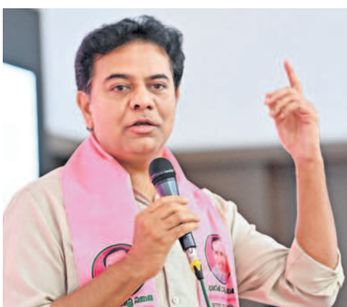
ఏర్పాటు చేసుకుంటే ప్రజలపై రూ.300 కోట్ల భారం పడుతుంది వివరించారు. పూర్తిగా ప్రభుత్వ ఖర్చుతోనే ఆ ట్రాన్స్ ఫార్మర్లు ఏర్పాటు చేయాలని ఆయన డిమాండ్ చేశారు. రేవంట్ రెడ్డి ప్రభుత్వం చేపట్టిన ఈ చర్య ప్రభుత్వ అసమర్థతకు నిదర్శనమన్నారు. వినియోగం పెరిగితే అందుకు అనుగుణంగా చేపట్టాల్సిన చర్యలు తీసుకోకుండా ప్రభుత్వం తప్పించుకోవడం సిగ్గుచేటని ఆయన మండిపడ్డారు. ప్రజలకు మౌలిక వసతుల కల్పన బాధ్యత ప్రభుత్వానిదేననే విషయాన్ని రేవంట్ రెడ్డి ప్రభుత్వం గుర్తించాలన్నారు.