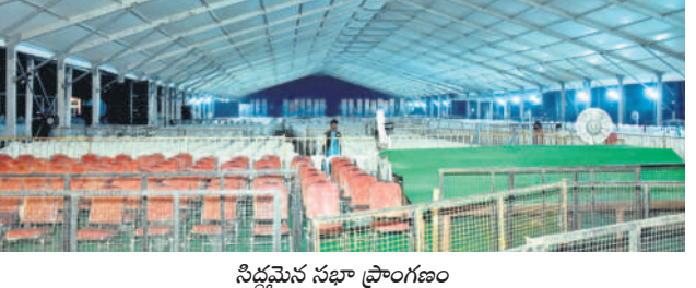
నిర్మించిన సభా ప్రాంగణం