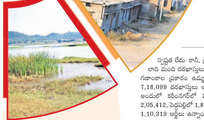
సూరమ్మ రిజర్వాయర్ కు అరకొరగా నిధులు

జగిత్యాల, నవంబర్ 19 (నమస్తే తెలంగాణ) : వేములవాడ నియోజకవర్గంలోని రుద్రంగి, కడలాపూర్, భీమారం మండలాలలోపాటు కొర్రుపల్లి, మెట్టపల్లి మండలాలలో కలుపుకొని మొత్తం 43,100 ఉద్దేశించింది సూరమ్మ కలికొట రిజర్వాయర్. శ్రీవాడ ఎల్లంపల్లి ప్రాజెక్టుపై ఆచారపడి ఎన్ ఐఐ స్టేజ్-2లో భాగంగా దాదాపు ₹400 కోట్లతో అంచనాలు రూపొందించారు. ఎన్నికల సమయంలో దీనిని పూర్తిచేస్తామని హామీ ఇచ్చారు. ప్రాజెక్టుతోపాటు కుడి, ఎడమ కాలువలు నిర్మించాలి ఉన్నది. కాగా, కాలువల నిర్మాణానికి ప్రభుత్వం ₹10 కోట్లు ముఖ్యంగా చేస్తున్నట్లు ఉత్తర్వులు జారీ చేసింది. 520 ఎకరాల భూ సేకరణకు ₹వంద కోట్లకు పైగా నిధులు అవసరం ఉండగా, కేవలం ₹10 కోట్లు మాత్రమే మంజూరయ్యాయి. ఆ నిధులు మంగళవారం ఉదయం వరకు జగిత్యాల కలెక్టర్ ఖాతాలో జమకాకపోవడం గమనార్హం.