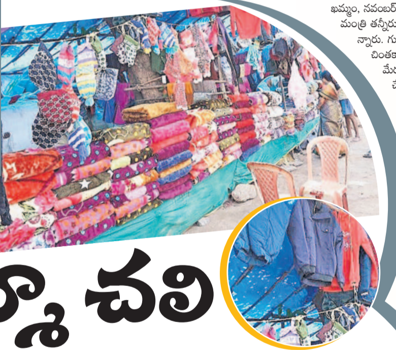
కొత్తగూడెం పట్టణంలో వెలిసిని సిస్టర్ల దుకాణాలు