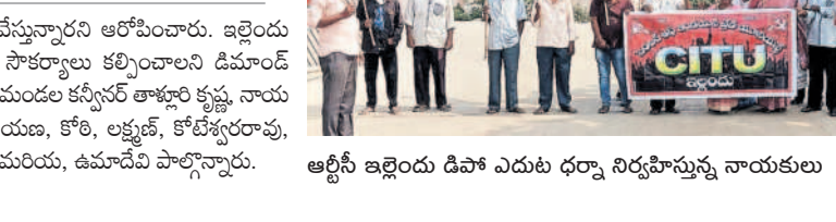
అట్లినీ ఇద్దరం డిపో ఎదుట ధర్నా నిర్వహిస్తున్న నాయకులు