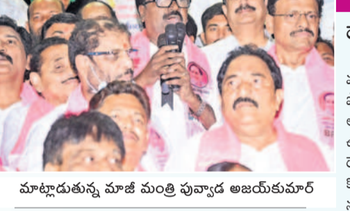
మాట్లాడుతున్న మాజీ మంత్రి పువ్వాడ అజయి కమలాకర్

నికీ చెందిన ఓ మంత్రి ప్రగల్భాలు పలికారని, వివరికి అవి సీఎం నయోజకపద్యంలో పేలాయని ఎద్దేవా చేశారు.