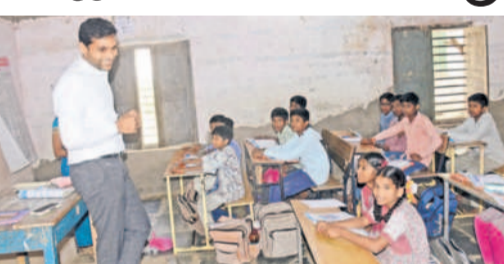
మధిర : తరగతి గదిలో విద్యార్థులతో మాట్లాడుతున్న కలెక్టర్

నుకున్నారు. అనంతరం డిజిటల్ లాబ్లో పిల్లలతో కలిసి కలెక్టర్ నేలపై కూర్చోని క్లాసు వీక్షించారు. ఈ సందర్భంగా కలెక్టర్ మాట్లాడుతూ విద్యార్థులు చిన్నతనం నుంచే లక్ష్యాలు ఎంచుకుని ఆ దిశగా కష్టపడి చదువాలని, విద్యతోనే సమాజంలో ఉన్నత స్థానాలకు ఎదగవచ్చున్నారు. ప్రభుత్వ పాఠశాలలో చదివే విద్యార్థులకు రెండు జతల ఏకరాస దుస్తులు, పాళ్లు, నోటీసుక్లీప్, నాణ్యమైన పాఠ్యాంశాలకు అందిస్తున్నట్లు తెలిపారు. జిల్లాలోని 50 పాఠశాలల్లో కివెన్ గార్డెన్ ఏర్పాటు చేసి కూరగాయలు పండిస్తున్నామని, వాటిని సంరక్షించే బాధ్యతను విద్యార్థులు తీసుకోవాలి. విద్యార్థులు అందరినీ భాషలోనే మాట్లాడుతునే విధంగా ఉపాధ్యాయులు వారిని ప్రోత్సహించాలని కలెక్టర్ సూచించారు.