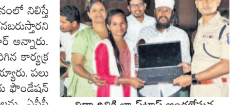
జగద్గిరిగట్లలో కుటుంబంలో ఒకరు చదువు చేసినప్పుడు మూడు తరాల ప్రతిభ కలిగి ఉంటుందని డి.ఎస్.ఎస్. కార్యకర్తలు అన్నారు

జగద్గిరిగట్ల, నవంబర్ 21 : కుటుంబంలో ఒకరు చదువు చేసినప్పుడు మూడు తరాల ప్రతిభ కలిగి ఉంటుందని డి.ఎస్.ఎస్. కార్యకర్తలు అన్నారు.