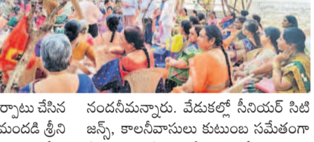
కేపీహెచ్బీ కాలనీలో కార్మిక వనభోజనాలు సందడిగా సాగాయి

కేపీహెచ్బీ కాలనీ, నవంబర్ 21 : కేపీహెచ్బీ కాలనీ 6వ ఫేజ్ సీనియర్ సిటిజన్స్ అధ్యక్షులు గురువారం నిర్వహించిన కార్యక్రమం వనభోజనాలు సందడిగా సాగాయి.