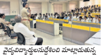
వైద్యవిద్యార్థులను దేశం విదేశాలకు పంపాలని పీసీపీ అధికారులు అన్నారు

దుండిగల్, నవంబర్ 21 : ర్యాగింగ్కు పాల్పడితే కఠిన చర్యలు తీసుకుంటారని పీసీపీ అధికారులు అన్నారు.