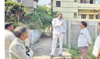
వరదల వల్ల ముంపు నుంచి కాపాడేలా నాలాల విస్తరణ చేపడుతున్నట్లు పీసీపీ కార్యాలయం అధికారులు అన్నారు

మియాపూర్, నవంబర్ 21 : వరదలతో కాల్వలు ముంపును గురి కాకుండా నాలాల విస్తరణ చేపడుతున్నట్లు పీసీపీ కార్యాలయం అధికారులు అన్నారు.