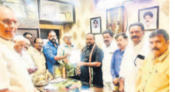
కార్యాలయ సహకారంతో అందరినీ కలెక్షన్లు సమర్పించాలని సూచించారు

బాలాసగర్, నవంబర్ 21 : విద్యుత్ ట్రాన్స్మిషన్ లైన్లు విద్యుత్ భారం వల్ల ముండ్లు పుట్టడం జరుగుతోందని భావిస్తున్నారని కుత్బుల్లాపూర్ ఎమ్మెల్యే కేపీ వివేకానంద్ అన్నారు.