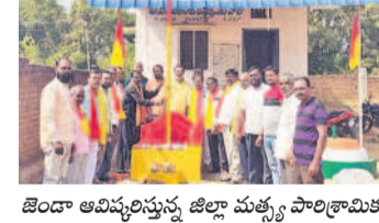
జిల్లా మత్స్యకారుల సంఘం అధ్యక్షులు అన్నారు

శామీరపేట, నవంబర్ 21 : మత్స్యకారుల అభివృద్ధికి ప్రభుత్వం కృషి చేయాలని జిల్లా మత్స్యకారుల సంఘం అధ్యక్షులు అన్నారు.