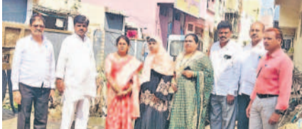
రాజారావునగర్లో నాలా నిర్మాణ పనులను పరిశీలిస్తున్న కార్యాలయ సహకారంతో అందరినీ కలెక్షన్లు సమర్పించాలని సూచించారు

అల్లూపూర్, నవంబర్ 21 : నాలా అభివృద్ధి పనులను త్వరగా పూర్తిచేయాలని కార్యాలయ సహకారంతో అందరినీ కలెక్షన్లు సమర్పించాలని సూచించారు.