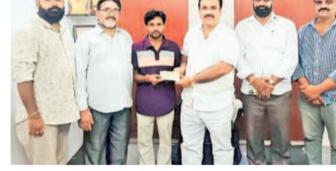
భారత్ కార్మికుల జీతం పెంచాలని కేపీహెచ్బీ కాలనీ కార్మికులు అన్నారు

కేపీహెచ్బీ కాలనీ, నవంబర్ 21 : భవన నిర్మాణ రంగ కార్మికుల హక్కుల సాధనకు పోరాడతానని కేపీహెచ్బీ కాలనీ కార్మికులు అన్నారు.