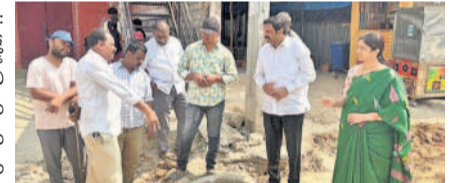
మియాపూర్ నగర్ డివిజన్ వద్ద పని ఎస్కేవీ సమన్వయంతో పని చేయాలని అధికారులు అన్నారు

మియాపూర్, నవంబర్ 21 : వివేకానంద్ నగర్ డివిజన్ వద్ద పని ఎస్కేవీ సమన్వయంతో పని చేయాలని అధికారులు అన్నారు.