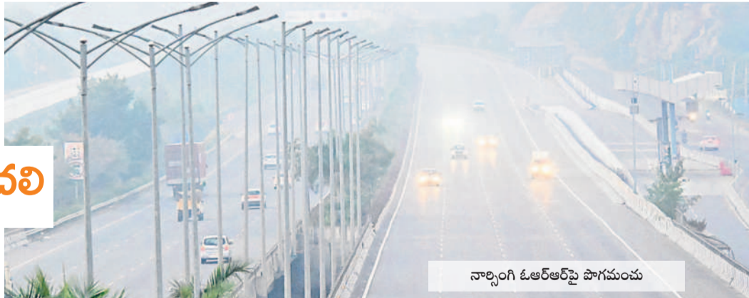
నార్సింగి ఓఆర్ఆర్పై పాగమంచు

రంగారెడ్డి జిల్లాలో చలి తీవ్రత రోజు రోజుకూ పెరుగుతున్నది. వాతావరణంలో మార్పులు చోటుచేసుకోవడంతో ఉదయం నుంచి రాత్రి వరకు చల్లటి గాలులు వీస్తున్నాయి. గత నాలుగు రోజులూ పగటి ఉష్ణోగ్రతలు గణనీయంగా పడిపోతున్నాయి. ఉదయం 8 గంటల వరకు మంచు కమ్ముకుంటున్నది. చలి తీవ్రం కావడంతో పిల్లలు, వృద్ధులు ఇబ్బందులకు గురవుతున్నారు. అలర్ట్, ఆస్తి, శాస్త్రసాధన, బీబీ, గుండె సంబంధిత వ్యాధులు కలిగిన వారు జాగ్రత్తలు తీసుకోవాలని వైద్యులు సూచిస్తున్నారు.