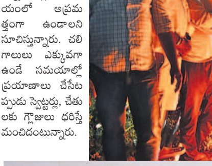
షాబాద్లో కమ్ముకున్న పాగమంచు

చలికాలం ప్రారంభంలోనే జనం వణికిపోతున్నాడు. జిల్లాలోని పలు మండలాల్లో ఉదయం ఎనిమిది గంటల వరకు మంచు కమ్ముకుంటున్నది. దీంతో ఉదయమే బయటికి వెళ్లే పాట వ్యాపారులు, కూరగాయల రైతులు, కార్మికులు, కూలీలు ఇబ్బందులు పడుతున్నారు. సాయంత్రం 5 నుంచి 8 గంటల తర్వాత చలి గాలులు వీస్తుండటంతో జనం ఇండ్లకి పరిమితమవుతున్నారు. వేడి మంటలు వేసుకుంటున్నారు. రానున్న రోజుల్లో చలి తీవ్రత మరింత పెరిగి అవకాశముందని వాతావరణ శాఖ అధికారులు పేర్కొంటున్నారు.