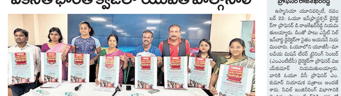
వికసిత భారత్ యంగ్ లీడర్స్ డైలాగ్ పోస్టర్లను విడుదల చేసిన శ్రీదాశులు, ఎన్.వై.ఎస్. ఎన్.వై.ఎస్. అధికారులు

బస్కోపేట్, నవంబర్ 22: జాతీయాభివృద్ధిలో యువత పాల్గొనాలి అని ప్రకటించారు.