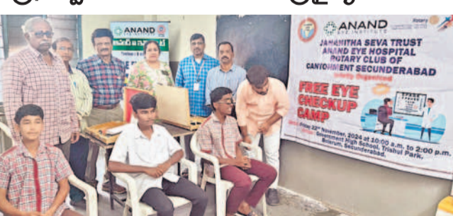
బోల్లారం శ్రీధర్ పార్కు ప్రభుత్వ పాఠశాలలో నేత్ర వైద్య శిబిరం నిర్వహిస్తున్న సిబ్బంది

బోల్లారం, నవంబర్ 22: కంటి వైద్యం పొందాలి అని ప్రకటించారు.