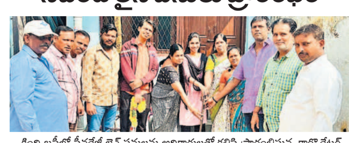
కింది బస్టీలో సేవరేజీ లైన్ పనులు అధికారులతో కలిసి ప్రారంభిస్తున్న కార్మిరేజీ

సికింద్రాబాద్, నవంబర్ 22: అభివృద్ధి పనులలో నాణ్యతా ప్రమాణాలు పాటించాలని సీనియర్ అధికారులతో కలిసి ప్రారంభించారు.