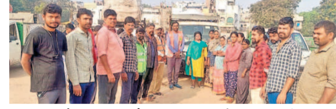
చెత్త సేకరణ బృందాలతో మాట్లాడుతున్న కార్మిరేజీలో రామం సునీత్

ఆర్డర్లు, నవంబర్ 22: ప్రజలకు మెరుగైన సేవలు అందించాలని ముషీరాబాద్ ఎమ్మెల్యే రామం సునీత్ తెలిపారు.