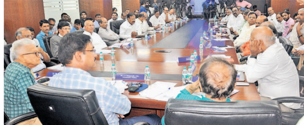
మధ్యపనలో ఉన్న హైద్రా కార్యాలయంలో రిల్వ్ ఇంజనీర్లు, నీటి పారుదల శాఖ నిపుణులు సమావేశంలో మూల్యాంకనం, హైద్రా కమిషన్ రంగనాథ్