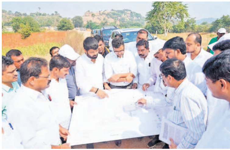
గత ప్రభుత్వం కొరబాద్ ఏర్పాటు చేయడంతోపాటు వండ్లమార్కెట్కు సంబంధించిన మ్యాప్