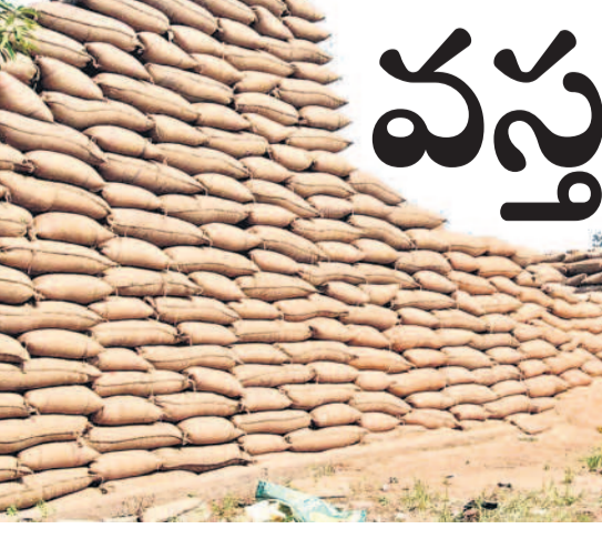
వడ్ల పైసలు వస్తలే..

మరోవైపు, రబీ సాగుకు రైతులు సన్నద్ధమవుతున్నారు. ఇప్పటికే కొన్నిచోట్ల నాల్గు పోయడం ప్రారంభించారు. అయితే, విత్తనాలు, ఎరువుల కొరతం చేతిలో చిల్లి గవ్వ లేక కర్షకులు సతమతవుతున్నారు. కేసీఆర్ హయాంలో పంట సాగుకు ముందే ఎకరాకు రూ.5 వేల చొప్పున రైతుబంధు ఇచ్చి అన్నదాతలకు అండగా నిలిచారు. అలాగే, పంట అమ్మిన తర్వాత నాలుగైదు రోజుల వ్యవధిలోనే రైతుల ఖాతాల్లో డబ్బులు జమ చేసే వారు. కానీ, కాంగ్రెస్ వచ్చాక పరిస్థితి పూర్తిగా మారిపోయింది. ఇప్పటికే వానాకాలం రైతుబంధు డబ్బులను రేవంట్ సర్కారు ఎగ్జిక్యూట్ చేసింది. రబీలోనూ ఇలాంటి సమస్యకంటే తీకుండా పోయింది. కనీసం పంట పైసలు వస్తే అయినా పెట్టుబడికి ఉపయోగపడతాయని ఆసక్తితో అవి కూడా రావడం లేదని రైతులు ఆవేదన చెందుతున్నారు. రైతులకు మేలు చేసే కేసీఆర్ ను ధూరం చేసుకుని, ఆసుభవిస్తూమని చెబుతున్నారు.