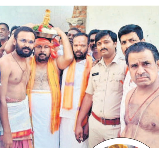
బంగారు భైరవ విగ్రహాన్ని తీసుకువచ్చున్న ఆలయ ఈవో, పూజారులు