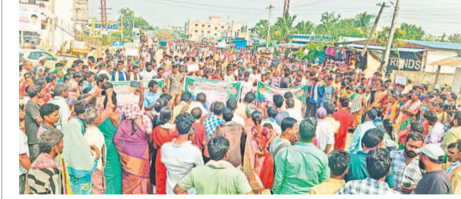
ఏటూరునాగారంలో ర్యాలీ నిర్వహిస్తున్న అదివాసీలు