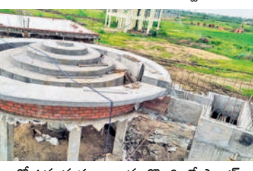
నిర్మాణంలో ఉన్న వృద్ధ జలాలను తోలగించే ప్లాంట్

తో పాటు పూర్తిస్థాయిలో పరిశ్రమలు ఏర్పాడైతే నిరంతరం నీటిని పంపింగ్ చేసేందుకు సిద్ధంగా ఉన్నట్లు డి.జి. శ్రీనివాస్ తెలిపారు. పైపైలైన్ పనులను వేగంగా పూర్తిచేసిన భగీరథ ఇంజనీరింగ్ అధికారులు ఇటీవల రెండు మోటార్లను ఆన్ చేసి ఎలాంటి ఆటంకాలు లేకుండా త్రయం రన్ నిర్వహించారు.