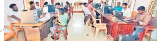
సర్వే వివరాలను కంప్యూటర్లో నమోదు చేస్తున్న అవతరణ