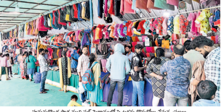
హనుమకొండ పాత మున్సిపల్ మైదానంలో స్వెటర్లను కొనుగోలు చేస్తున్న ప్రజలు

శక్తి తగ్గుతుంది, వీటన్నింటినీ తట్టుకోవడానికి తగిన జాగ్రత్తలు తీసుకోవాలి. వ్యాధుల బారిన పడకుండా ఉంటామని డాక్టర్లు చెబుతున్నారు. వ్యవసాయానికి ప్రతికూలం ఒక్కసారిగా పెరిగిన చలితో వ్యవసాయ రంగంపై తీవ్ర ప్రభావం చూపనున్నది. ప్రస్తుతం చాలాచోట్ల వరి కొరతలు పూర్తయ్యాయి. నార్లు పోసుకుంటున్నారు. అయితే ఈ చలి వల్ల మొలకెత్తే పరిస్థితి లేదు. మొలక శాతం తక్కువగా వస్తుందని రైతులు చెబుతున్నారు. ఇతర పంటలు కూడా ముఖ్యంగా రాపి అంటున్నారు. పశువులు వ్యాధుల బారిన పడే అవకాశం ఉంటుంది. వైద్యులు చెబుతున్నారు.