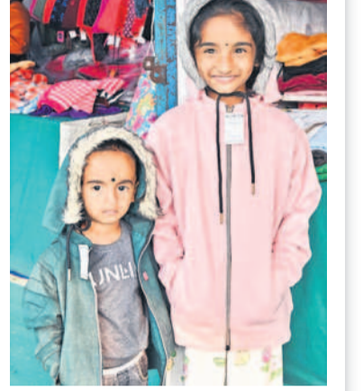
కొత్త స్వెటర్లు ధరించి మునిసిపాల్స్కు విన్నూరులు