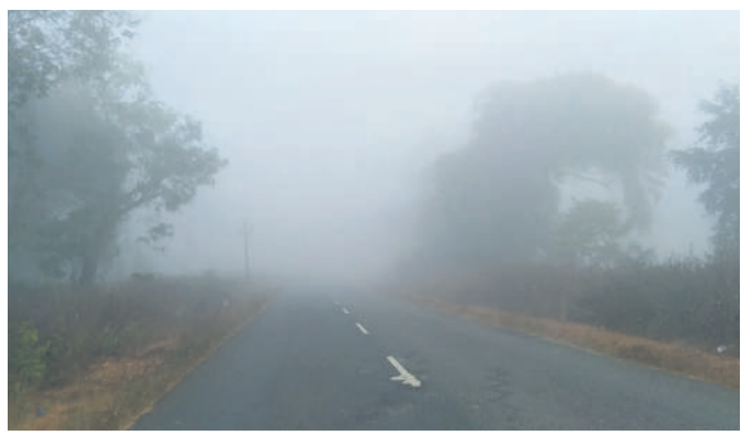
వాణిజ్య మండలంలోని ప్రగతిపల్లిలో రూపొందిన కమ్యూనున్న మంచుదబ్బటి