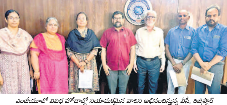
ఎంజీయూలో వివిధ హోదాల్లో నియామకమైన వారిని అభినందిస్తున్న వీసీ, రిజిస్ట్రార్