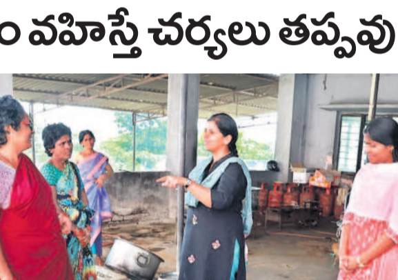
ఎస్సీ గురుకుల పాఠశాలలో పంటల నిబంధిత మాట్లాడుతున్న కలెక్టర్ ఇలా త్రిపాఠి

విధుల్లో నిర్లక్ష్యం వహిస్తే చర్యలు తప్పవు ● నల్లగొండ జిల్లా కలెక్టర్ ఇలా త్రిపాఠి ● కొండమల్లేపల్లిలో ఎస్సీ గురుకుల బాలికల పాఠశాల ఆకస్మిక తనిఖీ