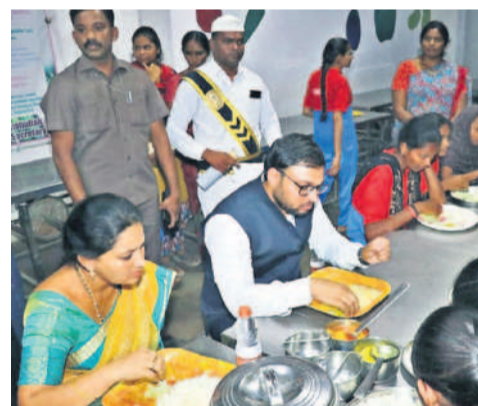
హుజూర్ నగర్ మైనార్టీ పాఠశాలలో విద్యార్థులతో కలిసి భోజనం చేస్తున్న కలెక్టర్ తేజస్ నందలాల్ పవార్

కలిపి 9,24,188 కార్డులు ఉండగా వాటికి నెలనెలా 5,946 మెట్రిక్ టన్నుల బియ్యం పంపిణీ చేయాల్సి ఉంటుంది. అంటే ఈ లెక్కన రెండు జిల్లాల కలిపి ఇప్పటి వరకు 5,300 మెట్రిక్ టన్నుల సన్న ధాన్యం కొనుగోలు చేయగా.. వివరించకుండా సుమారు 20వేల మెట్రిక్ టన్నులకు మించి కొనుగోలు చేయడం గగనమే అని అధికారులు చెబుతున్నారు. మరో వక్క ప్రస్తుతం సన్న ధాన్యానికి గిరాకీ పెరుగుతుంది. హైదరాబాద్ తోపాటు ఇతర ప్రాంతాల నుంచి బయ్యర్లు వస్తుండడంతో రోజురోజుకు సన్న వడ్డ ధరలు పెరుగుతున్నాయి. రాష్ట్ర వ్యాప్తంగా కొనుగోలు సెంటర్ నుంచి రైతులు పండించిన పంటలో 10 శాతం కూడా ప్రభుత్వం కొనుగోలు చేయకపోవడం గమనార్హం. మరి రేషన్ కార్డులపై సన్న బియ్యం పంపిణీ చేయడానికి ఎక్కడి నుంచి తెస్తారు..? ఈ స్వీచ్ తులం ఎలా అమలు చేస్తారనేది ప్రశ్నార్థకంగా మారింది. ఈ సేవల్లో ఈ పథకం కూడా అటకెక్కున ధ్వేసిన పలువురు పేర్లుంటున్నారు.