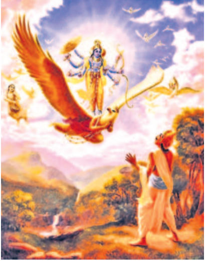
మనోని, సారాప్యాన్నిచ్చి, వైకుంఠానికి బయల్దేరమన్నాడు. చోళరాజు ఇది చూడగలిగాడు. ముద్దులునితో ‘మహారీ! నిరుపేద విప్రుడు వైకుంఠానికి వెళ్తున్నాడే! ఐశ్వర్యం ఉండి, గొప్ప యజ్ఞాలు చేసి, భూరి దానాలు చేసినా నాకు ఏ లాభం లేకపోయింది. భగవంతుడిని చేరేందుకు భక్తి తప్ప మరొకటి లేదని తెలిసింది’ అంటూ యజ్ఞాన్ని వదిలేసి హరినామ స్మరణతో హోమాగ్నిగుండంలో దూకాడు. చోళరాజును శ్రీహరి అక్కన చేర్చుకొని గుండం నుంచి వెలువడ్డాడు. అతనికి సారాప్యా

‘భక్తియోగం’ నిరుపద్రవ, భక్తియోగానుకూల అంటుంది. త్రిపాద్యుభూతి మహా నారాయణ ఉపనిషత్తు. అంటే ‘భక్తి యోగం నిరపాయకమైనది. దీనితో ముక్తి లభిస్తుంది’ అని భావం. ఈ ఉపనిషత్ వాక్యానికి కింద పేర్కొన్న కథ భాష్యంగా కనిపిస్తుంది. పూర్వం కాంచీపూర్ణి చోళచక్రవర్తి పాలించేవాడు. ఆయన గొప్ప విష్ణుభక్తుడు. ఆర్థ్యాటంగా ఖర్చుపెట్టి ఎన్నో యజ్ఞాలు చేసేవాడు. ఒకనాడు సువర్ణ పుష్పార్చన చేశాక గుడికి ‘విష్ణుదాసు’డనే బ్రాహ్మణుడు వచ్చి, తులసి దళాలతో దేవుణ్ణి పూజించాడు. ఇది రాజుకు నచ్చలేదు. ఇదే పూజ అన్నాడు. బ్రాహ్మణుడు కోపించి, ‘నీకు భక్తి లేదు.’ అన్నాడు. చోళరాజు వెలుకారంగా ‘నేనెన్ని క్రతువులు చేశానో తెలుసా! ఎవరు ముందు విష్ణు సాక్షాత్కారాన్ని పొందుతారో చూద్దాం’ అనే ముద్దులడనే ముని ఆధ్వర్యంలో గొప్ప విష్ణుయోగం సంకల్పించాడు. బ్రాహ్మణుడు దీక్షగా కార్తీక ప్రతం, షోడశోపచార పూజలు, కీర్తనలతో ఆరాధించినాగాదు. ఒకనాడు విష్ణుదాసుని ఆహారాన్ని ఒక డింగ్ అపహరించాడు. వరుసగా వారం రోజులు ఆలాగే జరిగింది. విష్ణుదాసుని అన్యం లేదు. అయినా దైవార్థన మానలేదు. ఒకరోజు దొంగను కనిపెట్టాలని నక్కి కూర్చుంటే ఒక చందాలుడు వచ్చాడు. అన్న వంజరం లాంటి శరీరం, ఆకలితో ఆరాటం, బ్రాహ్మణుడెంతో బాధపడ్డాడు. వాడు ఆహారాన్ని దొంగిలించుకొని పోతుంటే.. ‘అగవయా!’ కేవలం అన్నం ఎలా తింటావు? ఈ నెయ్యి కూడా కలుపుకొని ఆరగించు’ అని దొంగ వెంటంట్లుగా విష్ణుదాసును. భయంతో వాడు పారిపోతూ ఒకచోట సొమ్మసిల్లి పడిపోయాడు. విష్ణుదాసుని సవర్ణలతో తేరుకున్న చందాలుని స్నానంలో శ్రీహరి సాక్షాత్కరించాడు. బ్రాహ్మణుడు కన్నులారా దర్శించి ‘నారాయణా! కరుణించావా స్వామీ! నేను వేసుకుని కడపారా భుజించు’ అని అన్నం ముద్దు నివేదించాడు. శ్రీహరి ఆరగించాడు. దేవతలు ఆశ్చర్యపోయారు. శ్రీహరి విష్ణుదాసుని కొగలిం