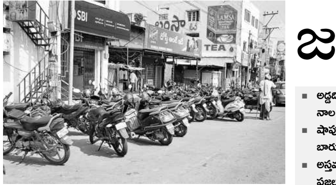
బ్యాంకు ఎదుట వాహనాల పార్కింగ్

జనగామ పట్టణం జిల్లా కేంద్రంగా మారడంతో వాహనాల రద్దీ విపరీతంగా పెరిగింది. సిద్దిపేట-సూర్యాపేట, వరంగల్-హైదరాబాద్ జాతీయ రహదారిపై రాత్రిలబంతు వందలాది వాహనాల రాకపోకలతో నిత్యం ఛోరస్థానంగా ఉంటుంది. ఛోరస్థానం సిగ్నలింగ్ వ్యవస్థ ఉన్నా కంట్రీ లైన్లకు వాహనాల రాకపోకలు అడ్డంకుగా సాగుతుంటాయి. ట్రాఫిక్ పోలీసులు ప్రతిరోజూ పనిచేస్తుంటారు. అయితే ఛోరస్థానం వల్ల వాహనాల రాకపోకలు అడ్డంకుగా సాగుతుంటాయి. ట్రాఫిక్ పోలీసులు ప్రతిరోజూ పనిచేస్తుంటారు. అయితే ఛోరస్థానం వల్ల వాహనాల రాకపోకలు అడ్డంకుగా సాగుతుంటాయి.