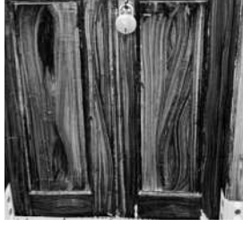
రాజు ఇంటికి తాళం వేసిన దాయాదులు