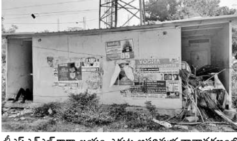
బీఎన్ఎన్ఎల్ కార్యాలయం ఎదుట అపరిశుభ్ర వాతావరణంలో మియోగంలో లేని మరుగుదొడ్డు