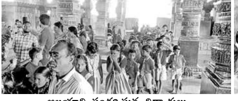
అలయాన్ని సందర్శిస్తున్న విద్యార్థులు

భూపాలపల్లి పట్టణంలో మరుగుదొడ్డును నిర్మించేందుకు ప్రధాన కూడళ్లను పరిశీలిస్తున్నాం. ప్రజలు కాలకృత్యాల తీసుకునేందుకు అనుకూలమైన ప్రదేశాలను గుర్తిస్తున్నాం. మేము పరిశీలింపిన స్థలాలపై మున్సిపల్ కార్యాలయంలో సంబంధిత అధికారులతో సమావేశాన్ని ఏర్పాటు చేసి, మరుగుదొడ్డు నిర్మాణాన్ని చేపట్టేందుకు నిర్ణయం తీసుకుంటాం. అలాగే, గతంలో నిర్మించిన మరుగుదొడ్డును కూడా మియోగంలోకి తీసుకువస్తాం. - డి. రాజేశ్వర్, భూపాలపల్లి మున్సిపల్ కమిషనర్