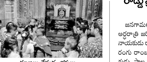
పూజలు చేస్తున్న భక్తులు