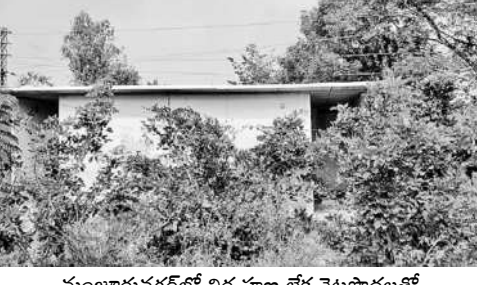
మంజూరునగర్లో నిర్వహణ లేక చెట్లపడలతో పాడుబడి పోతున్న మరుగుదొడ్డు