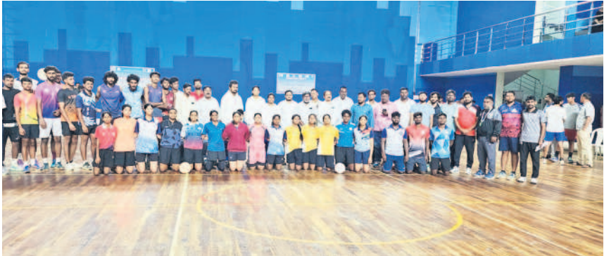
శ్రీధాకారలను అభినందిస్తున్న నెట్ బాల్ అసోసియేషన్ సభ్యులు