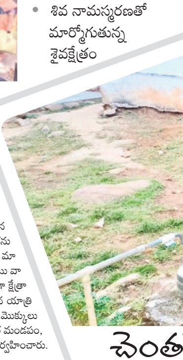
నల్ల సుందీ వచ్చే తాగునీటి కోసం ఎదురుచూస్తున్న మహిళలు